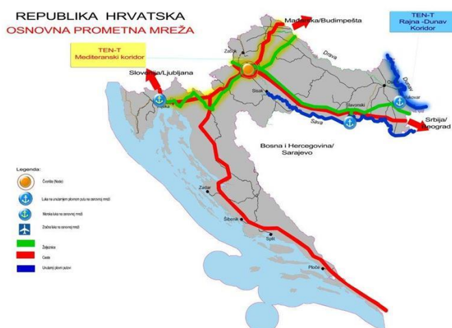
Slika 3. Položaj Hrvatske u prometnoj mreži

Hrvatska je smještena na dva koridora Osnovne prometne mreže: Mediteranskom koridoru i Rajna-Dunav koridoru. Mediteranski koridor povezuje jug Iberijskog poluotoka s mađarsko-ukrajinskom granicom, prolazeći kroz Španjolsku i Francusku mediteransku obalu, Alpe na sjeveru Italije, Sloveniju, te dalje prema istoku. Ovaj koridor obuhvaća cestovni i željeznički promet, a njegov dio čini i pravac Rijeka-Zagreb-Budimpešta, poznat kao Vb koridor. Na Mediteranski koridor nadovezuje se pravac Zagreb-Slovenija, kod nas poznat kao X koridor, koji povezuje Hrvatsku s Baltičko-jadranskim koridorom, koji vodi od Baltičkog mora preko Poljske, Beča i Bratislave do sjeverne Italije. Rajna-Dunav koridor, poznat kao VII koridor, riječni je pravac koji povezuje Strasbourg, Frankfurt, Beč, Bratislavu i Budimpeštu, odakle se grana prema Rumunjskoj i Crnom moru, prolazeći Dunavom između Hrvatske i Srbije. [12]