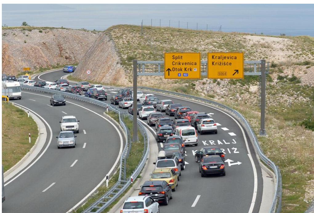
Slika 6. Uključivanje i isključivanje iz prometa

Uvođenjem ovih rješenja sigurno može poboljšati stanje prometnih čvorišta, smanjiti zagušenje i povećati prvenstveno sigurnost i učinkovitost prometa na prometnim čvorištima. [16]