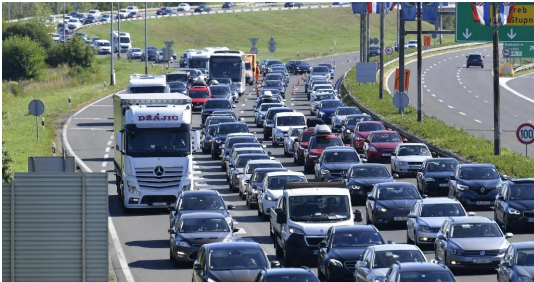
Slika 5. Prikaz zagušenja prometa