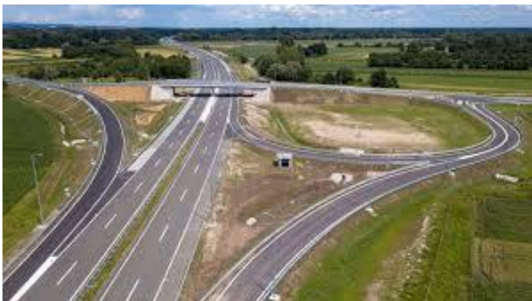
Slika 4. Prikaz prometnog čvorišta

Prometna čvorišta su mjesta gdje se spajaju dvije ili više cesta međusobno povezana. Na njima dolazi do križanja, ispreplitanja, spajanja ili razdvajanja prometnih tokova. U cestovnoj mreži čvorišta predstavljaju ključne točke koje omogućuju funkcioniranje cijelog prometnog sustava. Prilikom odabira lokacije i načina izgradnje čvorišta, svaki slučaj treba pažljivo analizirati, jer nepravilno projektirano čvorište, osobito na prometnijim cestama, može predstavljati ozbiljan rizik za sigurnost prometa. [13]