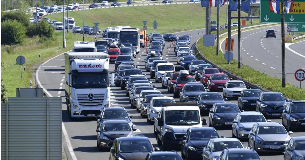
Slika 5. Prikaz zagušenja prometa