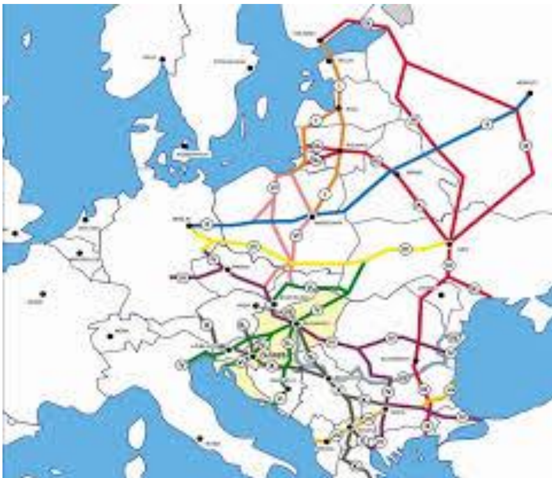
Slika 2. Paneuropski prometni koridori

Pan-Europski prometni koridori predstavljaju mrežu ključnih cestovnih i željezničkih pravaca osmišljenih s dugoročnim ciljem osiguravanja učinkovitog međunarodnog prometa unutar Europe, kao i između Europe i Azije. Ovi koridori dogovoreni su u suradnji između Europske unije, Ekonomske komisije Ujedinjenih naroda za Europu i Europske konferencije prometnih ministara, na konferencijama održanim u Pragu 1991., na Kreti 1994. i u Helsinkiju 1997., u kontekstu planiranog širenja Europske unije. Postoji deset paneuropskih prometnih koridora, a to su Baltičko-jadranski, Sjeverno more – Baltik, Mediteranski, Bliski istok – Istočni Mediteran, Skandinavsko-mediteranski, Rajnsko - alpski, Atlantski, Sjeverno more – Mediteran, Rajna – Dunav. [11]