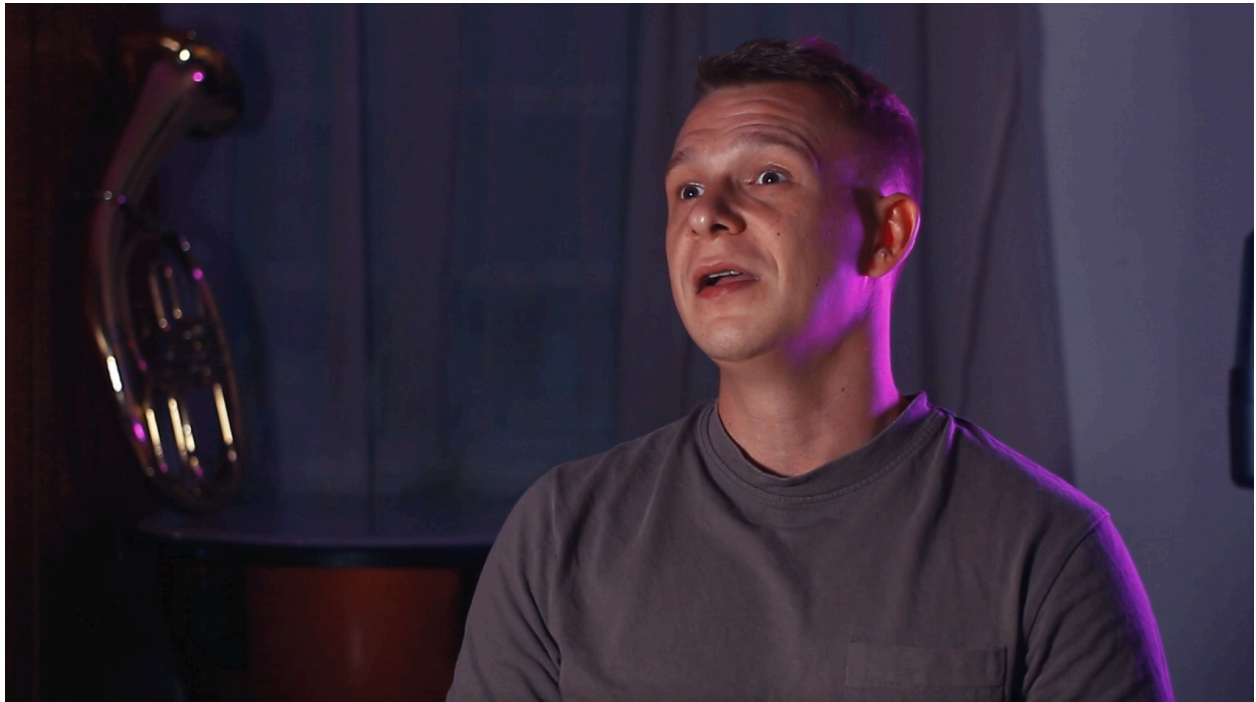
Slika 5.2. Kadar snimljen 85mm f/1.8 objektivom

Za dinamične snimke i prikaze prostora, koristio sam GoPro Hero 12 Black, koji se pokazao izuzetno korisnim za bilježenje pokretnih kadrova i snimaka s neobičnih perspektiva. Snimanje iz zraka ostvario sam pomoću DJI Avata 2 FPV drona, čije snimke su filmu dale dodatnu dimenziju i omogućile gledatelju da u potpunosti doživi prostor u kojem djeluje Gradska glazba. Uz to, koristio sam iPhone 12 Pro za snimanje spontanih trenutaka, čime sam dodao još jednu vrstu perspektive, osobito tijekom proba i druženja članova.