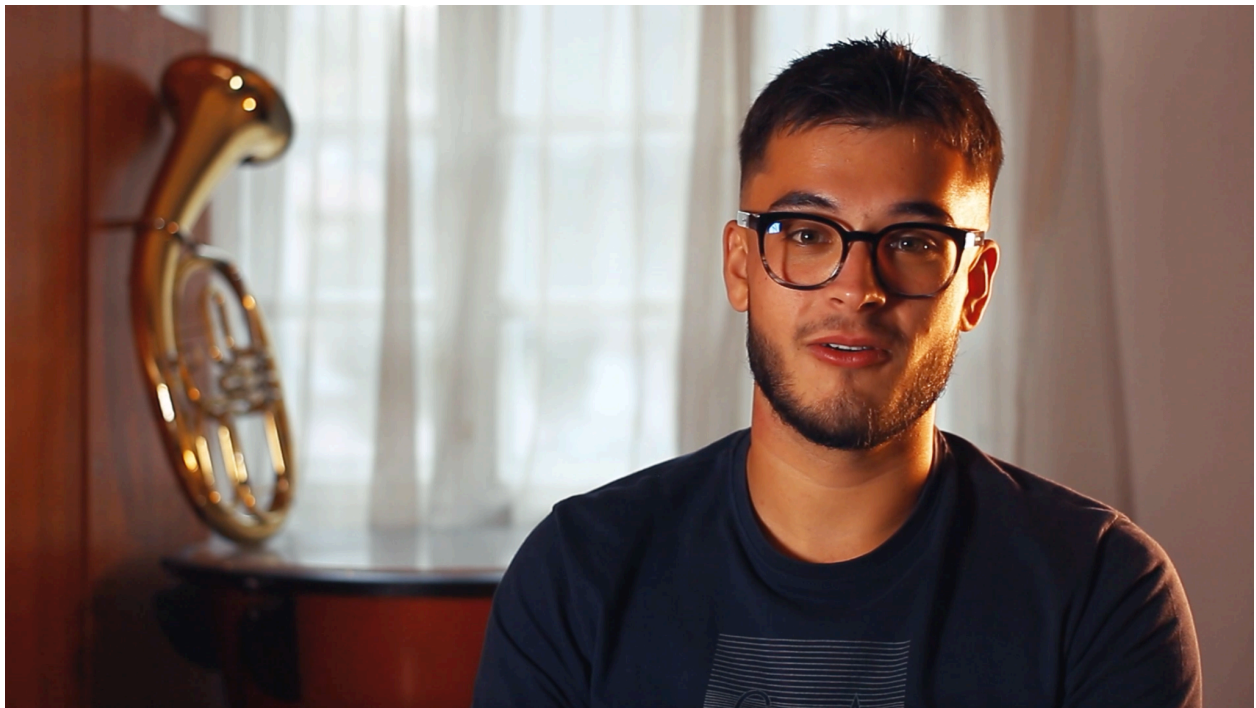
Slika 5.3. Kadar snimljen 40mm f/2.8 objektivom

Što se tiče zvuka, koristio sam SE Electronics kondenzatorski mikrofonski montiran na teleskopski mikrofonski kabel. Mikrofonski je bio povezan s Focusrite Scarlett 2i2 audio sučeljem, što mi je omogućilo snimanje čistog i kvalitetnog zvuka za intervjue. Zvuk je, kao i slika, imao ključnu ulogu u prenošenju emocionalne snage priča sudionika i njihova osobna iskustva s Gradskom glazbom. U intervjuima i dijalozima bilo je važno zadržati prirodan ton i jasnoću, zbog čega je odabir profesionalnog mikrofona i kvalitetnog sučelja bio ključan.