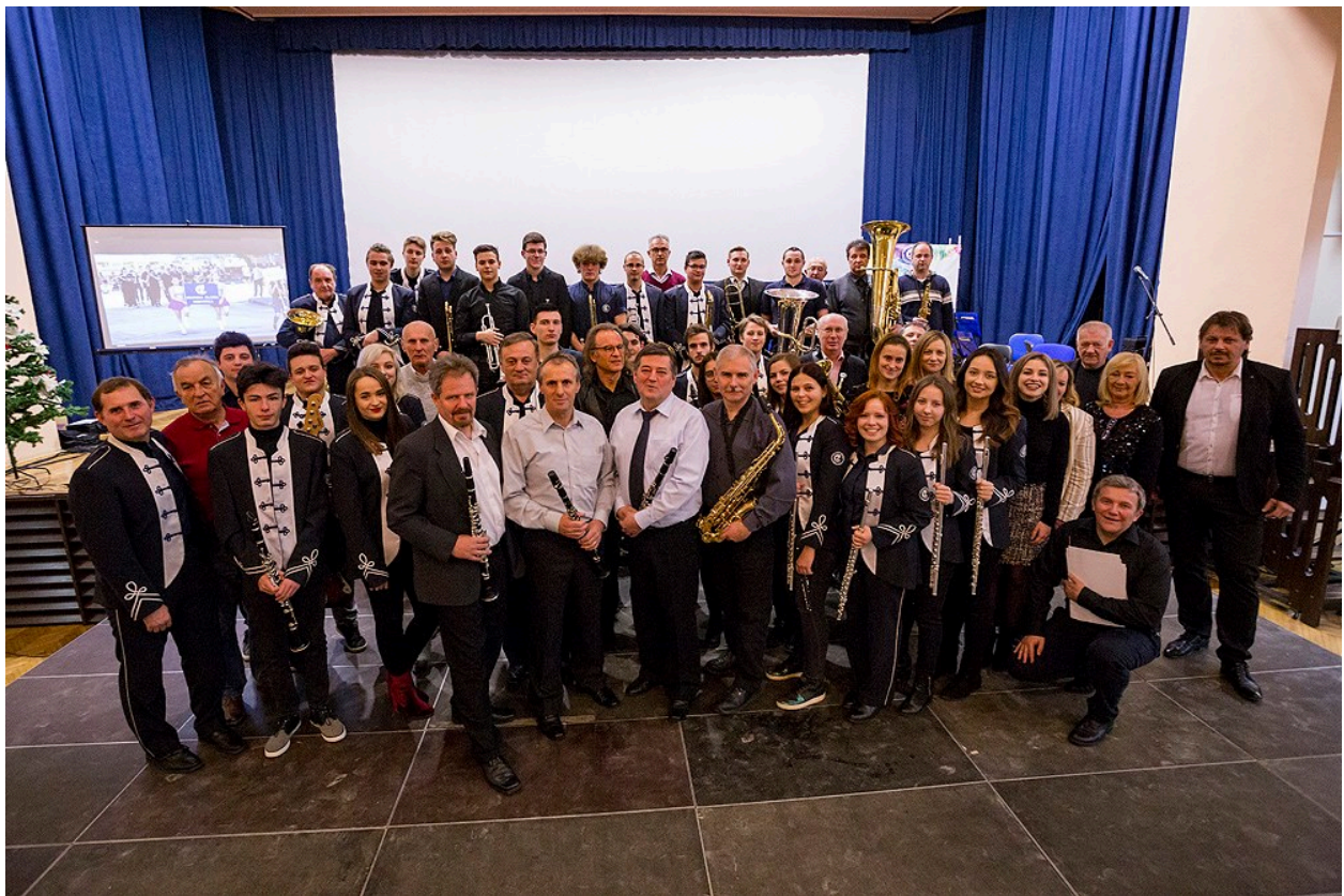
Slika 4.1. Gradska glazba Virovitica