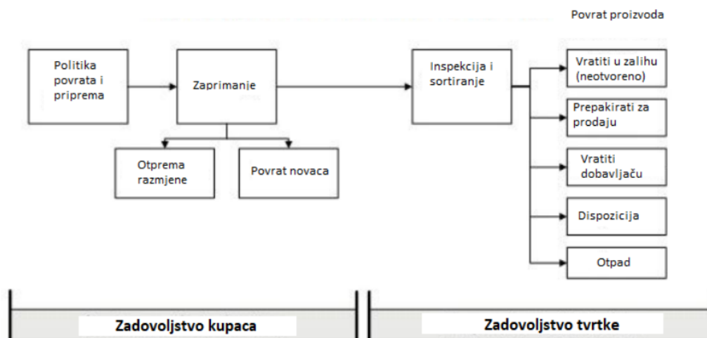
Slika 1 Ključne komponente povratne logistike u E-Commerceu