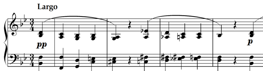
Primjer 4.3.1. Početak druge varijacije sa relativnim ritmičkim izmjenama (taktovi 1-4)

U prvom dijelu (||: a :||, taktovi 1-12) primjetne su ritmičke izmjene, s produljenjem notnih vrijednosti na teškim dobama u gornjem glasu (taktovi 1-6). Ove promjene podupiru progresije alteriranih akorda. Prvi dio završava modulacijom u F-dur (taktovi 11-12), što je sukladno izvornoj tonalitetnoj strukturi.