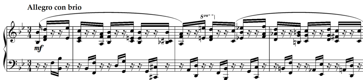
Primjer 4.4.1. Početak treće varijacije (taktovi 1-3)

Treća varijacija (taktovi 1-32) koja ima također trodijelni oblik u tonalitetu B-dura, karakterizirana je brzim tempom označenim kao „Allegro con brio“. Ova varijacija koristi bogatstvo tematskog materijala iz Mozartovog originalnog menueta, s posebnim naglaskom na ritmičku razradu. U čitavoj varijaciji ističe se relativna ritmička promjena, izrazito prisutna u šesnaestinskim notnim vrijednostima unutar \frac{3}{4} metra, čime se postiže stalna napetost i pokretljivost unutar formalne strukture.