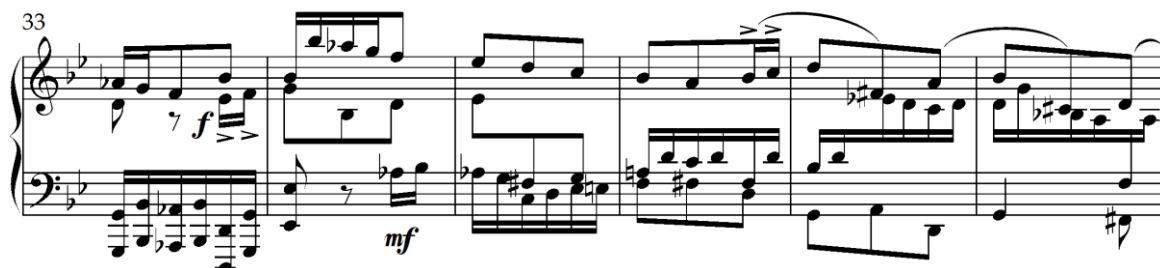
Primjer 4.8.2. Pojava strette u razvojnom dijelu (taktovi 33-38)

teme (taktovi 33, 36, 45, 47), te nepotpune imitacije tematskog materijala (taktovi 41-43; 45-47), stvarajući napetost i kontrapunktsku složenost.