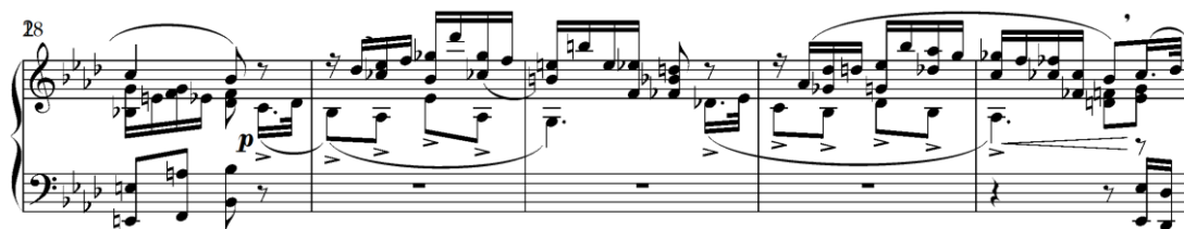
Primjer 4.7.2. Završetak drugog dijela (b, takt 18) i početak trećeg dijela (a, taktovi 19-22)

Drugi dio (b, taktovi 12-18), uobičajeno za trodijelnu formu, predstavlja kontrast prema prvom dijelu. Ovdje se javlja kromatsko sekvencijalno ponavljanje, koje postupno destabilizira tonalitet kroz uporabu alteriranih akorada i kromatskih prijelaza. Završetak drugog dijela obilježen je autentičnom kadencom u b-molu, što dodatno produbljuje osjećaj nesigurnosti tonaliteta. Time Schwarz stvara efekt "privremenog bijega" iz tonalitetne strukture, prije nego što se vrati u temeljni tonalitet u trećem dijelu.