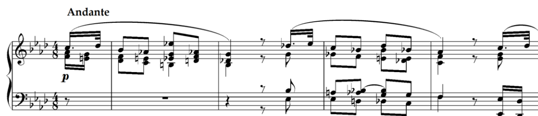
Primjer 4.7.1. Početak šeste varijacije na VI, stupnju As dura (f mol, taktovi 1-4)

Šesta varijacija donosi suptilne, ali ključne promjene u tonalitetu i metričkoj strukturi, prelazeći iz ranijeg tonaliteta u As-dur i 4/8 mjeru umjerenog tempa, zadržavajući trodijelni oblik (a b a). Rikard Schwarz u ovoj varijaciji zadržava prepoznatljivost tematskog materijala, no uvodi ritmičke i melodijske promjene, osobito kroz alterirane akorde, uklone i proširenja harmonijskih okvira. Ove promjene omogućuju dinamičan dijalog između izvorne teme i kreativne harmonizacije, čime skladatelj uspijeva dodatno obogatiti formu bez narušavanja njezine koherentnosti.