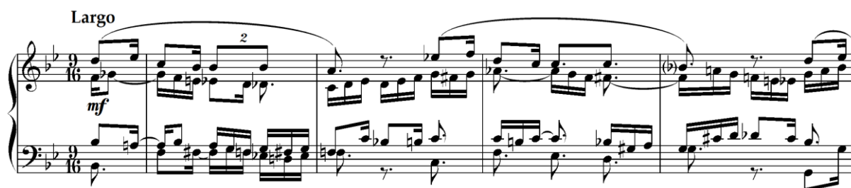
Primjer 4.5.1. Početak četvrte varijacije s relativnim ritamskim i melodijskim promjenama u četveroglasnoj strukturi (taktovi 1-4)

U četvrtoj varijaciji, Rikard Schwarz razrađuje tematski materijal prvog dijela (a) Mozartovog prvog menueta, smještenog u 9/16 mjeru i tonalitet B-dura. Varijacija započinje četverotaktnom frazom (taktovi 1-4), u kojoj se odmah očituje skladateljeva igra s ritmičkim aspektima vodeće melodije. U unutarnjim glasovima prisutni su prohodi i izmjenični tonovi, što dodatno obogaćuje zvučnu teksturu.