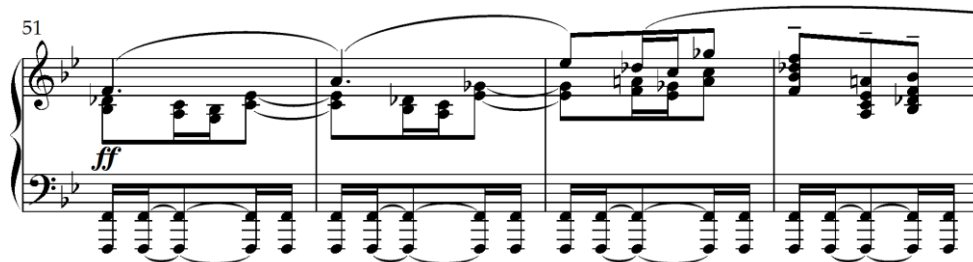
Primjer 4.8.3. Pedalni ton u završnom dijelu (taktovi 51-54)

Završni dio (druga provedba, taktovi 47-65) donosi povratak teme u osnovnom tonalitetu, ovaj put u homofonom slogu. Ovdje Schwarz koristi neakordičke tonove i kromatske prohode, čime proširuje harmonijski okvir i stvara privremeni odmak od početnog B-dura (taktovi 47-51). Potom uvodi pedalni ton na dominantu, iznad kojeg se tematski materijal razrađuje oktaviranjem (taktovi 51-57). Na kraju, skladatelj rekapitulira glavnu temu u osnovnom tonalitetu, zaključujući kompoziciju autentičnom kadencom (taktovi 57-65), čime se postiže formalna i tonalitetna cjelovitost skladbe.