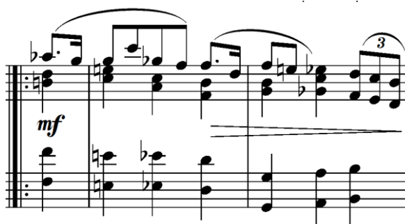
Primjer 4.2.2. Prikaz izdvajanja gornjeg glasa u drugoj varijaciji (taktovi 12-14)

Drugi dio (b) započinje dvotaktom (taktovi 12-14), u kojem je Rikard Schwarz na jednako kromatsko harmonijsko kretanje kao u b dijelu Mozartovog prvog menueta, izdvojio gornji glas u obliku melodije, dok ostali glasovi čine harmonijsku pratnju. Zatim slijedi mala glazbena rečenica (taktovi 15-18), u kojoj je obogaćena melodija uz isti harmonijski obrazac kao u izvornom menuetu. Ovaj dio završava kadencirajućim kvartsekstakordom na dominantnom akordu B-dura (takt 18).