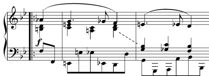
Primjer 4.3.2. Prikaz s punktiranim ritmom produženog trajanja i harmonijsko-melodijska figuracije u drugom dijelu druge varijacije (taktovi 12-14)

U drugom dijelu (b, taktovi 12-18) ističe se gornji glas s punktiranim ritmom produženog trajanja, dok harmonijsko-melodijska figuracija koristi kromatske progresije u obliku harmonijskih sekvenci. Slijedi mala glazbena rečenica (taktovi 15-18) s modificiranom melodijom, ali uz očuvanje istog harmonijskog modela kao u originalnom menuetu. Ovaj dio završava kadencirajućim kvartsekstakordom na dominantnom akordu B-dura (18. takt).