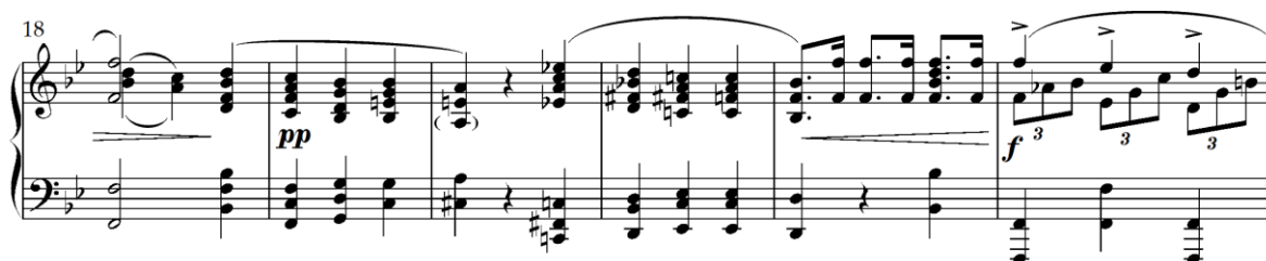
Primjer 4.3.3. Ponavljanje prvog dijela u drugoj oktavi (taktovi 18-23)

Ova varijacija može se smatrati strogom zbog vjernog zadržavanja formalne strukture (||: a :|| b a :||) i tonalnih odnosa. Međutim, istovremeno je i karakterna, jer promjena tempa značajno mijenja njezin izraz. Sporiji tempo omogućava dublju ekspresivnost, gdje alterirani akordi i produženi ritmički odnosi stvaraju kontemplativniju atmosferu. Iako formalno precizna, varijacija postiže snažan emotivni kontrast kroz suptilne harmonijske i ritmičke promjene.