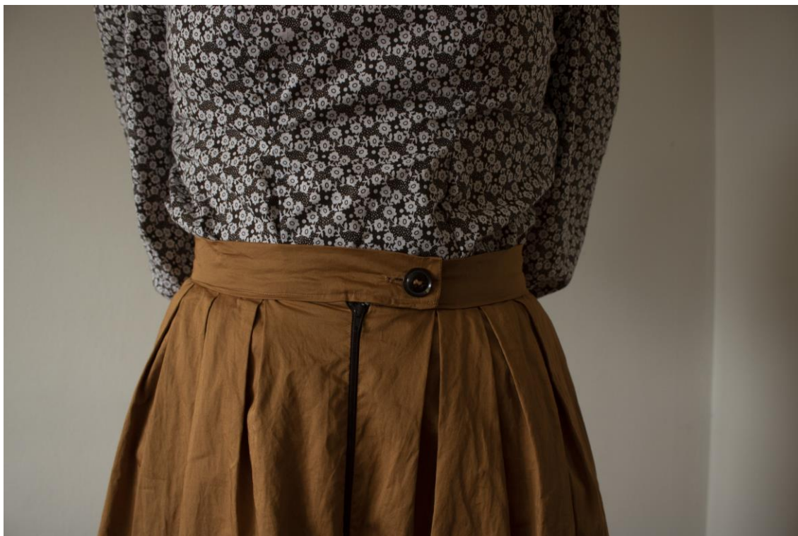
Slika 17: Detalj prednjeg dijela suknje, Autor

koji se elegantno nabire radi postizanja volumena. Nabori su bili pažljivo označeni i točno pozicionirani. Prednji dio suknje podijeljen je na dva dijela, uz diskretan patentni zatvarač smješten u sredini. Dio oko struka dodatno učvršćuje dugme.