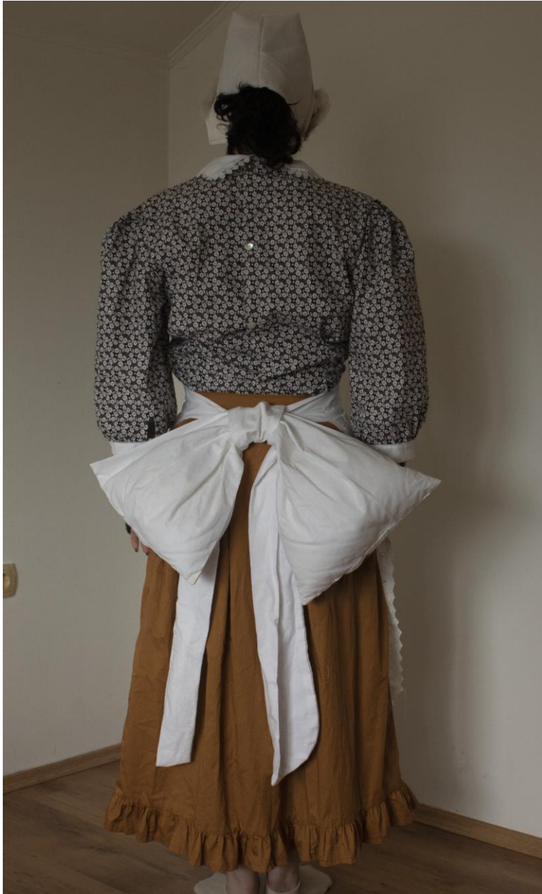
Slika 23: Kostim Colombine sa stražnje strane, Autor