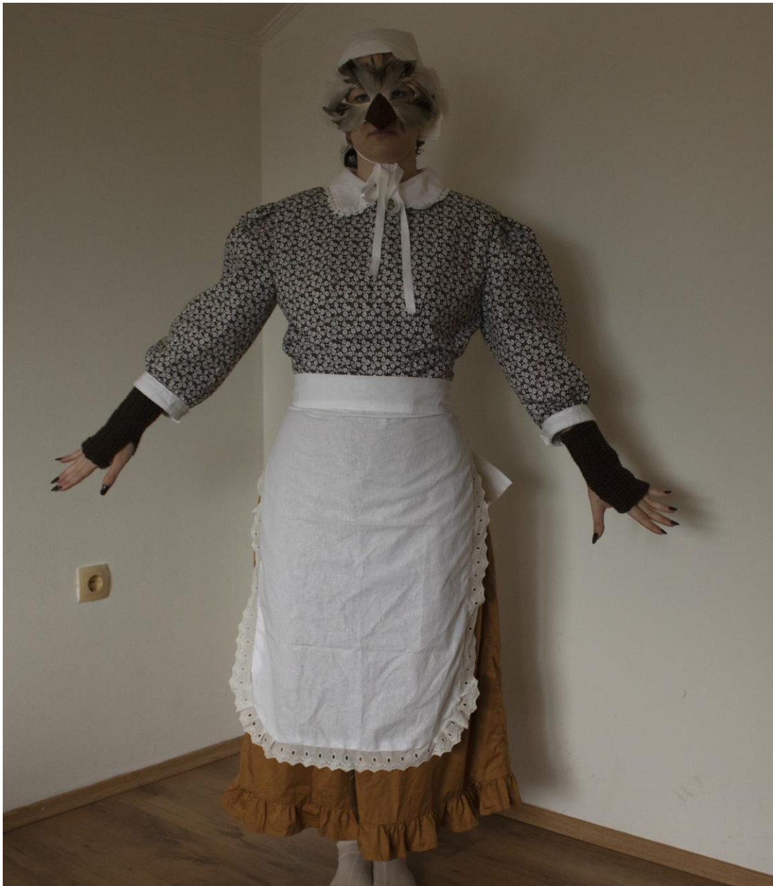
Slika 21: Kostim Colombine s prednje stane, Autor