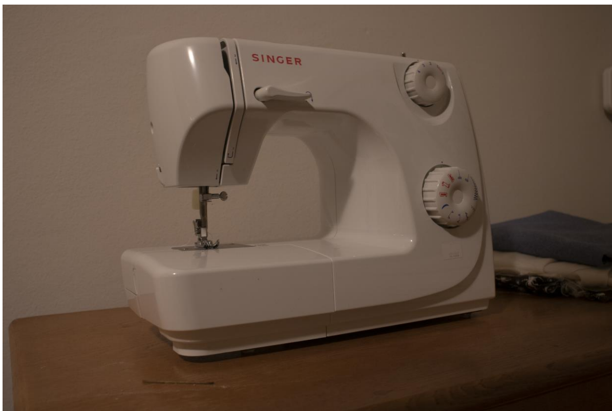
Slika 16: Korištena šivaća mašina: Singer 8280, Autor