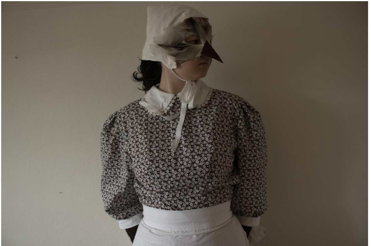
Slika 24: Prednji dio kostima, gornji dio, Autor