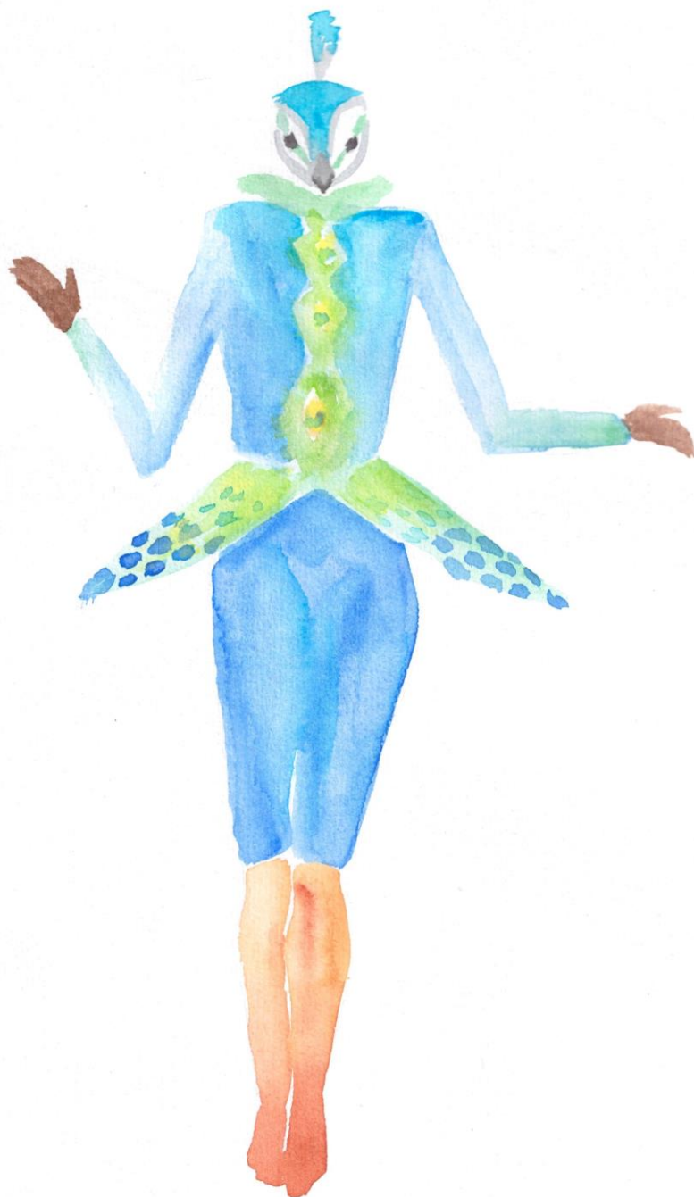
Slika 6: Ilustracija kostima Harlekin, tehnika akvarel, Autor

nalikuju na perje, omogućavaju glumcu slobodu kretanja i fizičke akrobacije, po čemu je Harlekin i poznat. Dodani su elementi koji povećavaju dinamiku kostima, kako se lik kreće, tako i perje i uzorci na kostimu stvaraju iluziju lepršavosti i živahnosti. Ovaj dizajn također koristi prirodne materijale i perje. Korištenje perja i prirodnih materijala daje dodatnu teksturu i bogatstvo kostimu, čime lik Harlekina postaje ne samo vizualno atraktivan, već i taktilno zanimljiv.