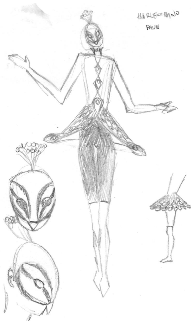
Slika 5: Ilustracija kostima Harlekina, tehnika olovka, Autor

Maska u ovom redizajnu također je inspirirana paunom. Oblikovana je kako bi podsjećala na glavu pauna, koristeći perje koje se podudara s paletom boja kostima. Peruške krase gornji dio maske, stilizirani ukrasni elementi oponašaju perje na glavi pauna. Maska ostaje vjerna tradicionalnoj ulozi u Commediji dell'arte, pokrivajući gornji dio lica i omogućavajući slobodu izražavanja mimikom donjeg dijela. Ovo je ključno za karakter Harlekina jer veliki dio njegovog humora proizlazi iz njegove mimike i ekspresivnosti. U ovom dizajnu naglasak nije samo na estetskoj privlačnosti, već i na fluidnosti pokreta. Elementi kostima, poput laganih tkanina koje