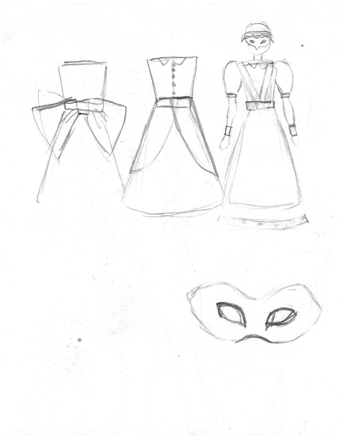
Slika 9: Skica kostima kod razrade kroja, Autor