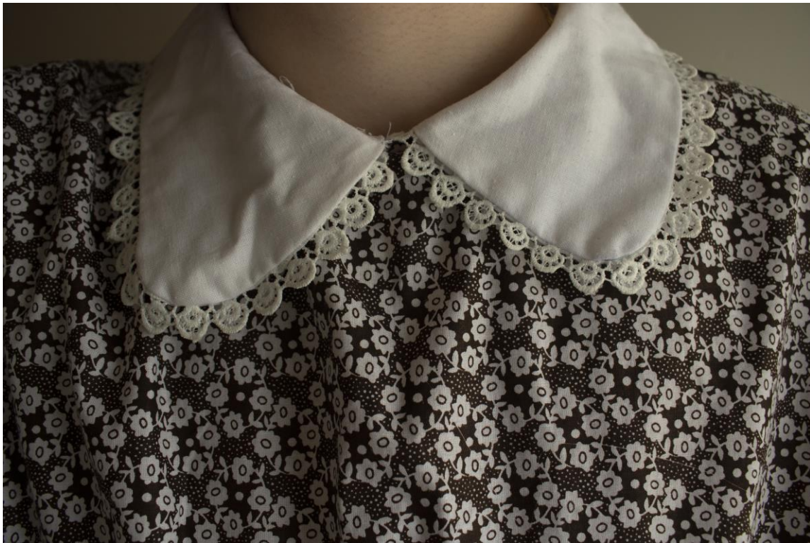
Slika 18: Kragna kostima, Autor