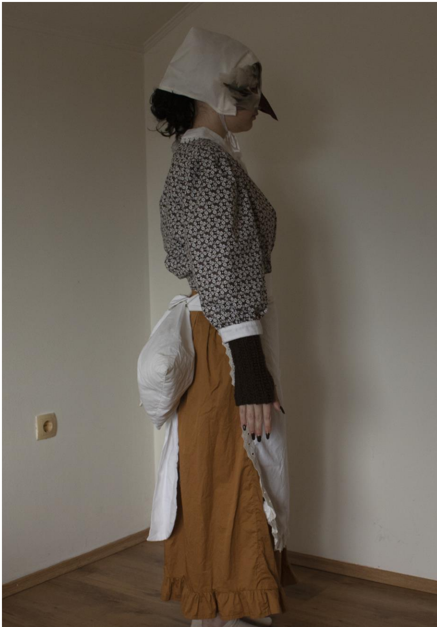
Slika 22: Kostim Colombine sa strane, Autor