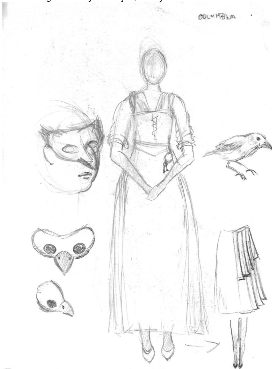
Slika 8: Prvobitna ilustracija kostima, tehnika olovka, Autor

postiže autentična tekstura i izgled koji evocira ptičje osobine. Nijanse smeđe, crne i bijele boje izabrane su kako bi odgovarale bojama vrapca, stvarajući sklad između maske i ostatka kostima.