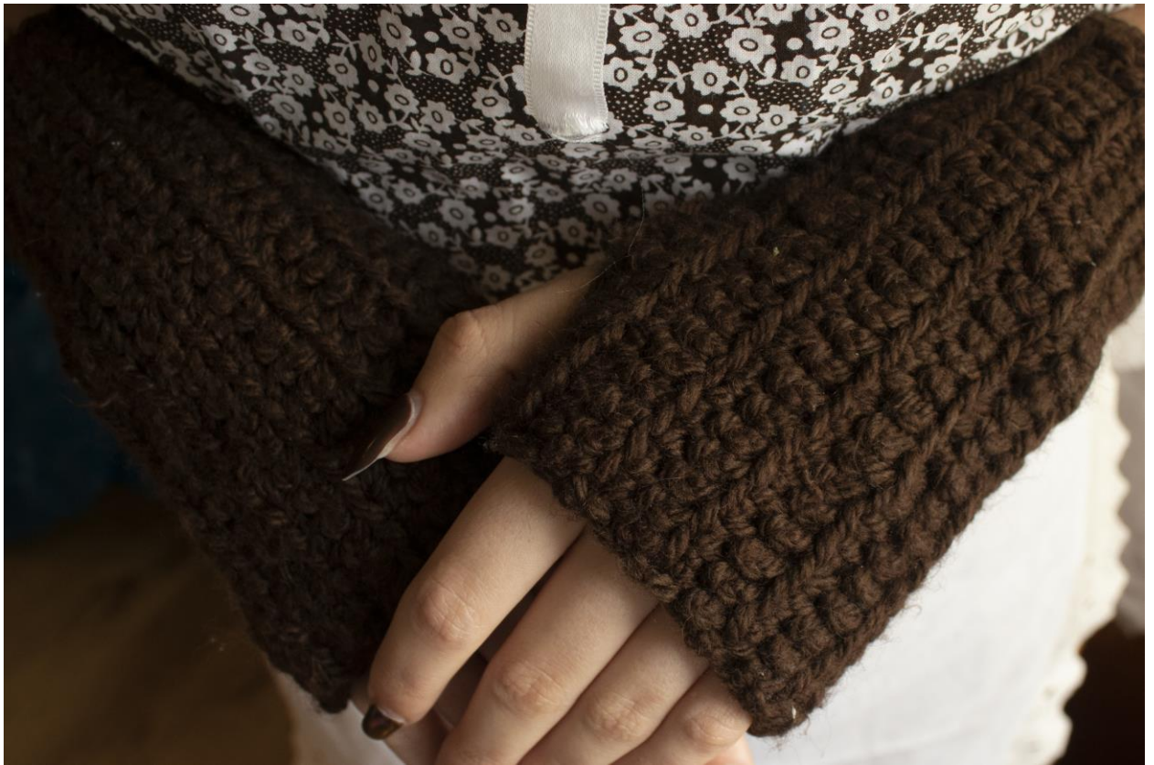
Slika 20: Detalj heklanih rukavica, Autor