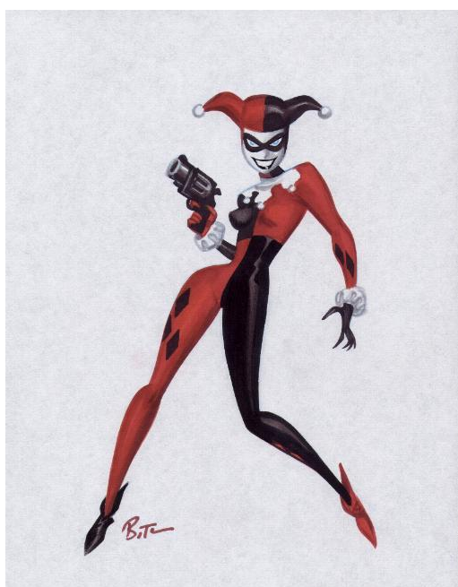
Slika 1: Harley Quinn

Iako Commedia dell'arte počinje opadati krajem 18. stoljeća, njezin utjecaj i dalje je prisutan u europskom kazalištu. Francuski pisci, poput već spomenutog Molièrea i dalje su koristili motive iz Commedije u svojim komedijama. Likovi poput Harlequina, Pierrota i Colombine postaju dijelom europske kazališne i kulturne baštine te se pojavljuju u različitim umjetničkim formama. Od slikarstva do baleta i opere pa čak kasnije i u pop kulturi. Tijekom 19. i 20. stoljeća, Commedia dell'arte ponovno oživljava kroz moderne oblike kazališta i umjetnosti. Kazališni pokreti poput ruskog avangardnog kazališta i dadaizma istražuju elemente improvizacije i fizičkog teatra, dok likovi iz Commedije postaju arhetipovi u modernoj kulturi. Filmski glumci kao što su Charlie Chaplin i Buster Keaton koriste fizičku komediju koja vuče korijene iz Commedije dell'arte. U današnjim medijima može se prepoznati inspiracija likovima iz Commedije u igranim filmovima, animiranim filmovima, stripovima i različitim drugim djelima. Tako vidimo očitu vizualnu inspiraciju u fiktivnom liku Harley Quinn (Dr. Harleen Frances Quinzel) iz stripova „Batman“ američke izdavačke kuće DC Comics. Lik Pantalonea možemo vidjeti u Gospodinu Burnsu iz popularnog crtanog serijala Simpsoni: opsjednutost novcem, pohlepa, a neki fizički manirizmi se čak mogu usporediti s glumom Pantalonea.