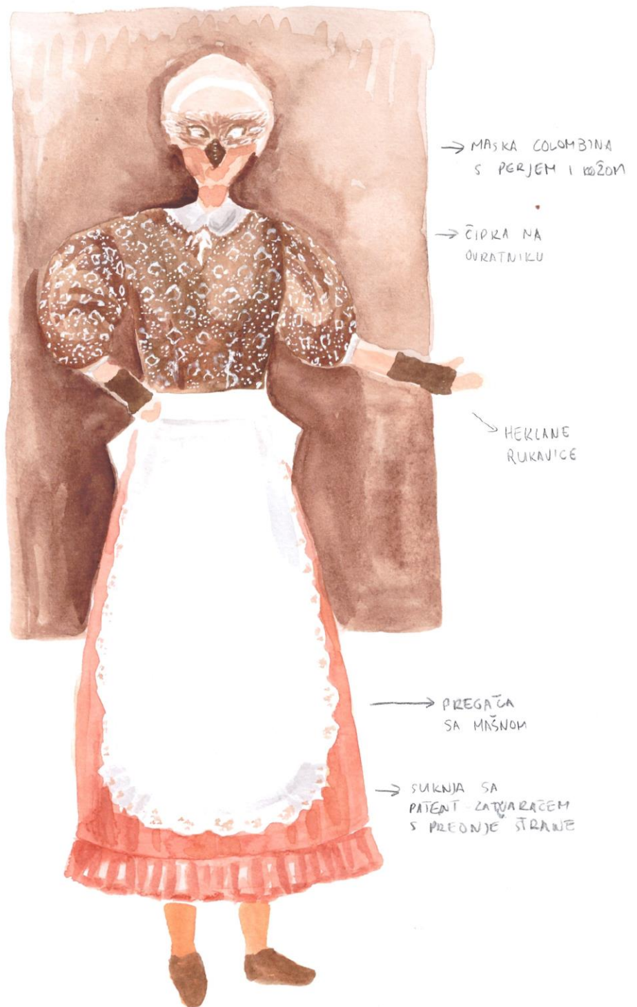
Slika 11: Ilustracija kostima Colombina, tehnika akvarel, Autor