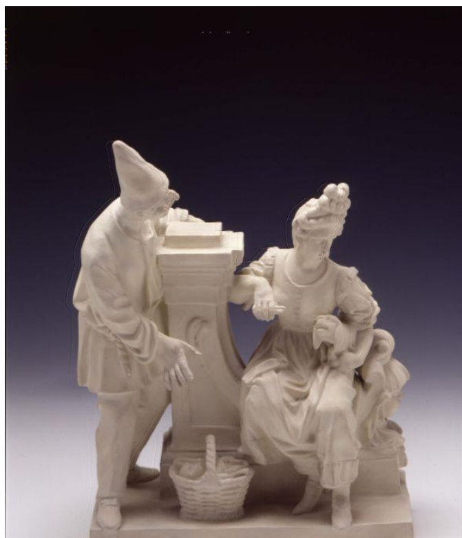
Slika 7: Kip likova Commedia dell'arte s prikazom lika sluškinje (desno)

U Commediji dell'arte, lik sluškinje je u početku igrao ulogu svodnice. Međutim, s razvojem žanra, njezina uloga se postepeno mijenjala te su joj komedije 18. stoljeća dodijelile funkciju ljubazne savjetnice. Iako su žene počele nastupati na pozornici nešto kasnije, njihov dolazak bio je prava novina za ove predstave. Prisutnost glumica donijela je novu dinamiku predstavama. Na početku su se sluškinje prikazivale kao starije žene – naborane, pogrbljene i s ograničenim mogućnostima. Tek kasnije, kako se žanr razvijao, pojavio se lik mlade služavke Zagne koja postaje živahna i dovitljiva figura na sceni. Jedna od najpoznatijih verzija ovog lika je Colombina. Karakter i odnosi s drugim likovima Colombina često nastupa uz Harlekina, svog družbenika i partnera s kojim dijeli jednaku razigranost i šarm. Prikazana kao lukava i inteligentna, Colombina nije samo sluškinja; često postaje ključni pokretač radnje smišljajući rješenja za probleme i spletke. Kostim često koristi prozračne, ženstvene tkanine u zemljanim tonovima kao što su smeđa, bijela ili svijetloplava kako bi se istakla veza s radničkom klasom i šarm koji privlači pažnju. Colombinin kostim ponekad uključuje detalje dijamanta nalik onima na harlekinu kada je s njim par u predstavi. Za razliku od drugih likova u Commedia dell'arte, Colombina rijetko nosi punu masku. Ako je ipak ima, obično se radi o polumaski koja otkriva njezino lice, što omogućuje glumici da izrazi emocije i šarmira publiku.