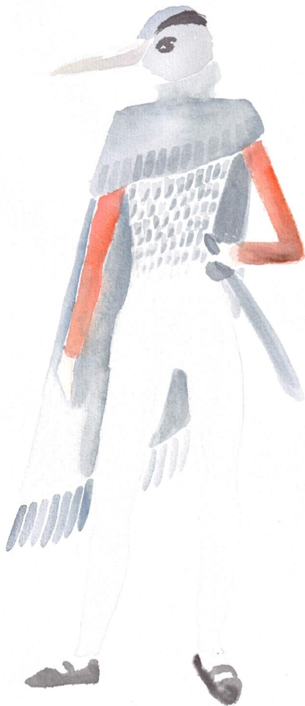
Slika 15: Ilustracija kostima Capitano, tehnika akvarel, Autor