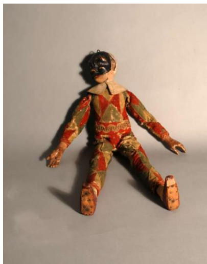
Slika 4: Lutka Harlekin

čineći ga jednim od najdinamičnijih likova u Commediji. Njegovo ponašanje je uvijek zaigrano, s izrazitim smislom za humor. Iako je često nespretnan, njegova domišljatost i sreća obično ga izvuku iz problematičnih situacija. Harlekin je poznat i po svom oštrom jeziku, stalnim dosjetkama i sposobnosti da se izvuče iz nevolje. On je prepreden, ali nije zao, njegova motivacija često dolazi iz zabave i igre, a ne iz zlonamjernosti. Također, poznat je po velikoj ljubavi prema hrani, što ga često vodi u komične situacije u kojima pokušava pribaviti nešto za jelo, bilo kroz prevare ili smicalice. Harlekinova uloga u Commediji često je da služi kao suprotnost ozbiljnijim likovima poput Pantalonea ili Il Dottorea, koje on nadmudruje svojom domišljatošću. Njegova dinamika s ljubavnim parovima, poput Innamorati, također je važna – on im pomaže u njihovim ljubavnim zavrzlamama, često riskirajući da ga njegovi gospodari kazne. Harlekin je poznat po svojoj vezi s Colombinom, inteligentnom i zavodljivom sluškinjom, koja je često i njegov ljubavni interes. Njihov odnos je dinamičan, pun igre i nadmudrivanja, gdje je Colombina često mudrija i sposobnija od njega, ali njihova interakcija izaziva niz komičnih situacija.