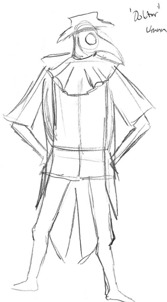
Slika 12: ilustracija kostima Dottore, tehnika olovka, Autor

Kostim Dottorea inspiriran je vizualnim i simboličkim elementima vrane, ptice često povezivane s mudrošću, intelektom te mračnijim aspektima. Lik Dottorea iz Commedije dell'arte , poznat po pretjeranom intelektualizmu i istovremeno komično nesposoban upravljati svakodnevicom, savršeno utjelovljuje ovu simboliku. Dizajn kostima kombinira tradicionalne osobine ovog lika s anatomskim motivima vrane i venecijanskih doktorskih maski kako bi se dodatno naglasila njegova karikaturalna, ali ozbiljna priroda. Kostim Dottorea temelji se na crnoj boji koja dominira cijelim izgledom, pružajući mračan i ozbiljan ton te evocirajući vranu, pticu simboličnu za mudrost, misterij i opreznost. Košulja je dizajnirana s prepoznatljivim, velikim stomakom koji Dottoreu služi kao komičan element. Ova izražena fizička karakteristika naglašava njegovu nespretnost i opsjednutost hedonizmom, dok se istovremeno suprotstavlja njegovom intelektualnom hodu. Na košulji se također nalaze suptilni krojevi inspirirani originalnim