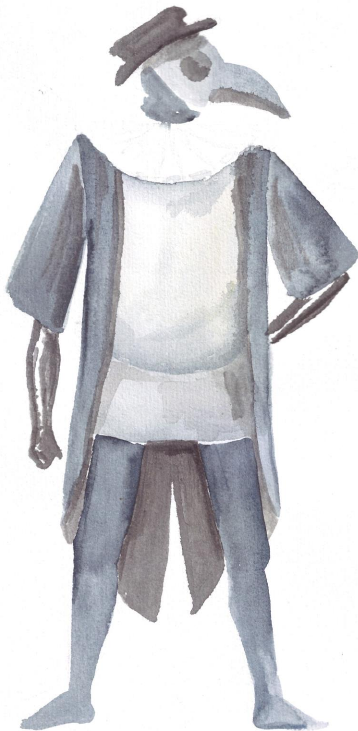
Slika 13: Ilustracija kostima Dottore, tehnika akvarel