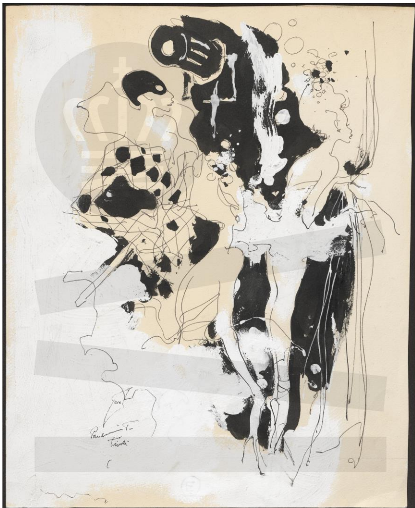
Slika 3: Ilustracija Harlekina (lijeva strana)

Harlekin (Arlecchino) jedan je od najpoznatijih i najživopisnijih likova Commedije dell'arte. Njegov lik utjelovljuje arhetip komičnog slugu, koji je uvijek prepreden, domišljat i fizički spretan. Iako je sluga, Harlekinova domišljatost i brzina u razmišljanju često ga stavljaju u poziciju da nadmudri svoje gospodare i druge likove. Njegova uloga u predstavi često je ta da izaziva kaos i smijeh kroz svoju nespretnost, komičnu zbrku i akrobacije. Harlekin je u povijesti Commedije dell'arte prvi put zabilježen u 16. stoljeću. Ime "Arlecchino" može imati germansko porijeklo i povezano je s "Hellequinom", demonološkom figurom iz francuskog folklora, no tijekom stoljeća Harlekin je evoluirao iz mračnog, grotesknog lika u vedriju i komičniju figuru. Lik Harlekina razvijao se kroz improvizacije glumaca, postajući sinonim za veselog i lukavog slugu koji je uvijek na strani ljubavi i često pomaže mladim ljubavnicima da se ujedine, dok istodobno nadmudruje bogatije likove. Harlekin je fizički izuzetno spretan, često se prikazuje kao akrobat i plesač. Njegove uloge u predstavi obiluju brzim pokretima, skokovima, prevrtanjima i pantomimom,