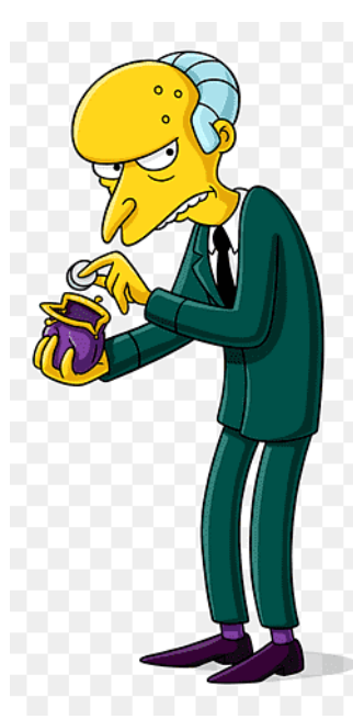
Slika 2: Gospodin Burns