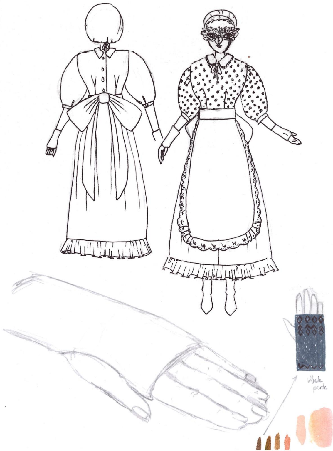
Slika 10: Razrađena skica kostima i dodatka, tehnika olovka, crni flomaster, Autor