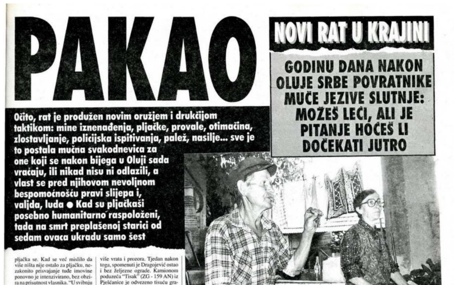
Slika 7 : primjer kategorije „odnos prema glavnoj temi“

nije naveden u niti jednom broju direktno ispod fotografija, na što se ova kategorija i odnosi već je na kraju svakog broja naveden impresum koji navodi ime i prezime autora fotografija.