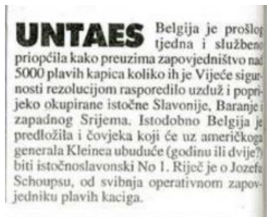
Slika 9: primjer jedne vijesti

Vijest sa slike 9 objavljena je u broju koji je izašao 12. veljače 1996. godine, skoro mjesec dana od službenog početka procesa mirne reintegracije hrvatskog Podunavlja. Vijest poštuje standarde profesionalnog novinarstva jer odgovara na svih 5 osnovnih pitanja koja vijest treba imati te donosi točne informacije. U ovoj vijesti zadovoljena je tema vanjskih utjecaja jer se konkretno govori o utjecaju UN-a.