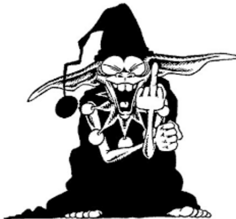
Slika 6: Logo Feral Tribune