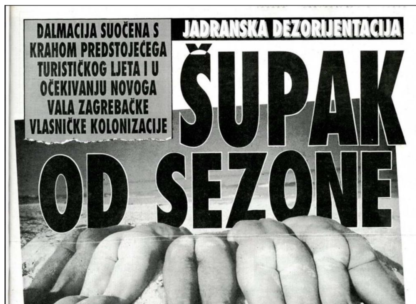
Slika 8: primjer kategorije „obojenost naslova“ i „fotografija“

Na ovom primjeru slike 8 prikazane su dvije kategorije. Ukoliko govorimo o naslovu ovo je konkretan primjer senzacionalističke obojanosti naslova. Isto tako ukoliko obratimo pažnju na fotografiju ona je također senzacionalistička. Feral Tribune ostao je prepoznatljiv zbog svoje eksplicitnosti u odabiru fotografije te senzacionalističkim naslovima. Naslovi su samim time lako uočljivi, upečatljivi i pamtljivi.