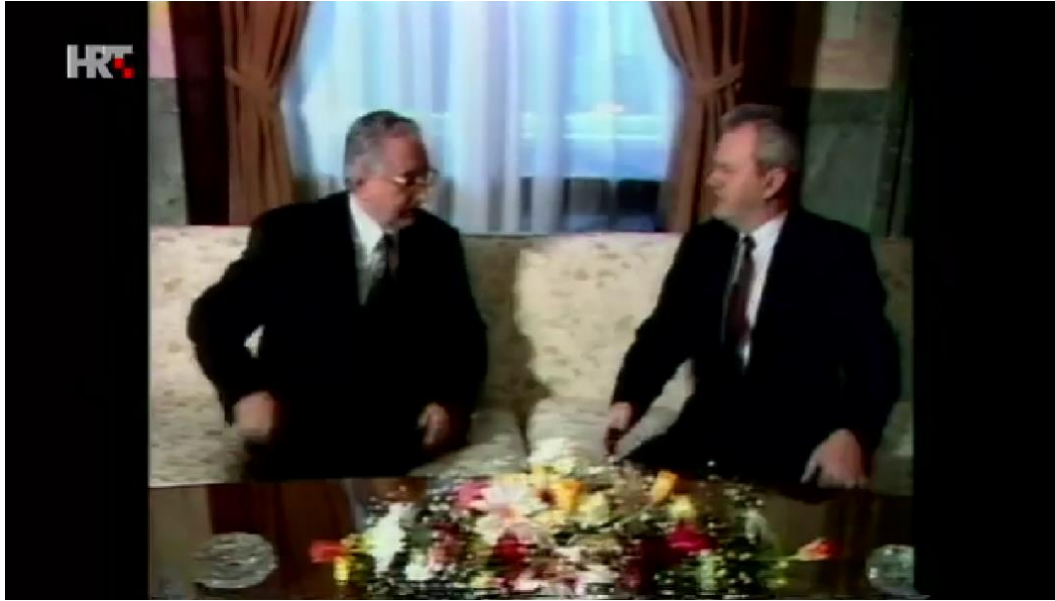
Slika 2: prvi susret Tuđmana i Miloševića – isječak iz videozapisa