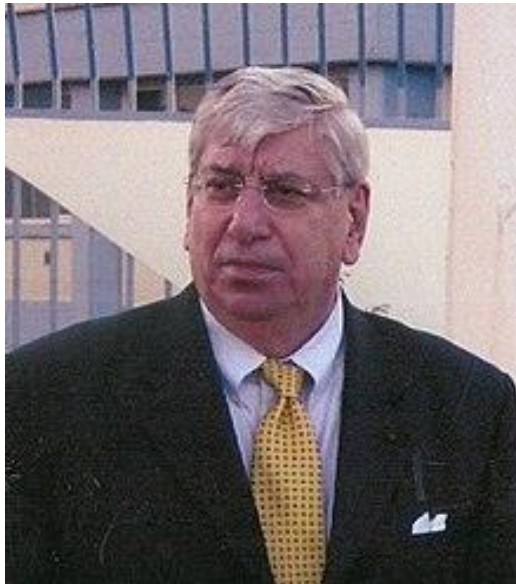
Slika 3: Jacques Paul Klein (izvor: https://en.wikipedia.org/wiki/Jacques_Paul_Klein )

Jacques Paul Klein umirovljeni je general Ratnog zrakoplovstva SAD-a.