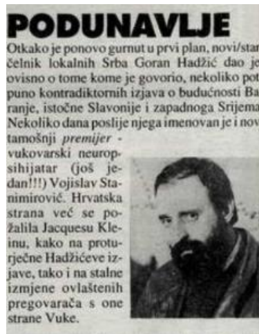
Slika 11: primjer jedne vijesti

Ovo je još jedan primjer uspješne vijesti koja je objavljena u broju koji je izašao 06. svibnja 1996.godine. Ovakvih vijesti ima nekoliko te služe kako bi se prikazalo stvarno stanje na terenu u to vrijeme.