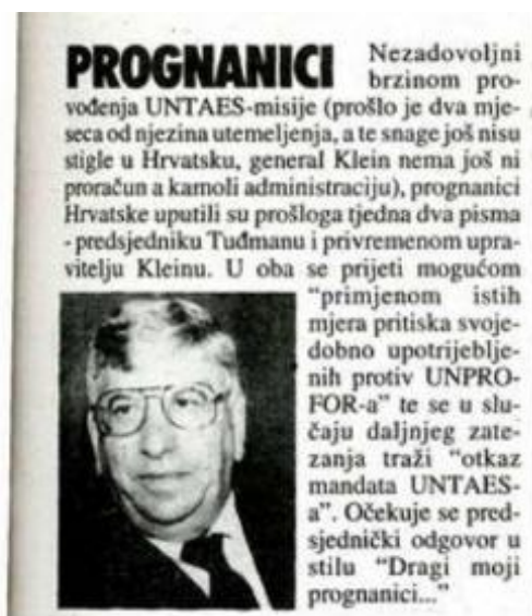
Slika 10: primjer jedne vijesti

Vijest sa slike 9 objavljena je u broju koji je izašao 12. veljače 1996. godine, skoro mjesec dana od službenog početka procesa mirne reintegracije hrvatskog Podunavlja. Vijest poštuje standarde profesionalnog novinarstva jer odgovara na svih 5 osnovnih pitanja koja vijest treba imati te donosi točne informacije. U ovoj vijesti zadovoljena je tema vanjskih utjecaja jer se konkretno govori o utjecaju UN-a.