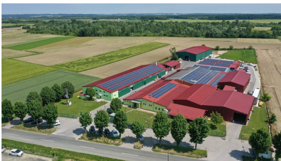
Slika 4 Tvrtka Eko papir prije druge faze postavljanja solarnih panela

U prvoj fazi na krovove tadašnjih proizvodnih hala i skladišta postavljeno je solarnih panela ukupnog kapaciteta od 175 kWh. Ova investicija je u značajnoj mjeri smanjila trošak struje za tvrtku uzeći u obzir da je tada bilo mnogo manje velikih potrošača električne energije. Međutim, stalnim širenjem proizvodnih kapaciteta, gradnjom proizvodnih pogona i kupnjom strojeva, ubrzo je postalo jasno da su potrebni dodatni kapaciteti kako bi se zadovoljile rastuće energetske potrebe.