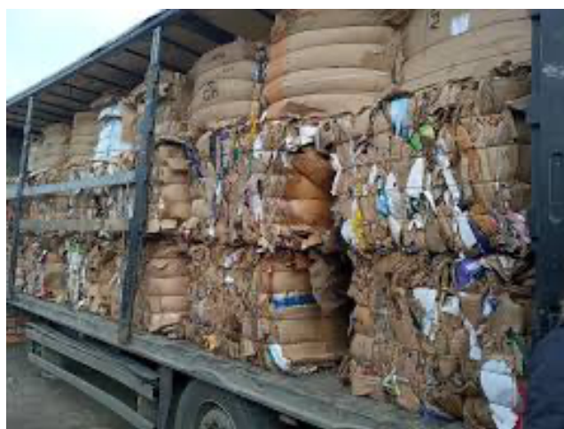
Slika 3 Prešani papir u balama

Budući da su svi proizvodi tvrtke Eko papir sačinjeni od papira ili kombinacije papira i folije, jasno je da se prilikom proizvodnje stvara proizvodni otpad. Kako bi se smanjio negativni utjecaj na okoliš i osiguralo odgovorno gospodarenje otpadom, otpadni papir i folija odvajaju se u preše koje komprimiraju otpadni papir ili foliju u čvrste povezane bale. Te bale se privremeno skladište u skladišnim prostorima tvrtke.