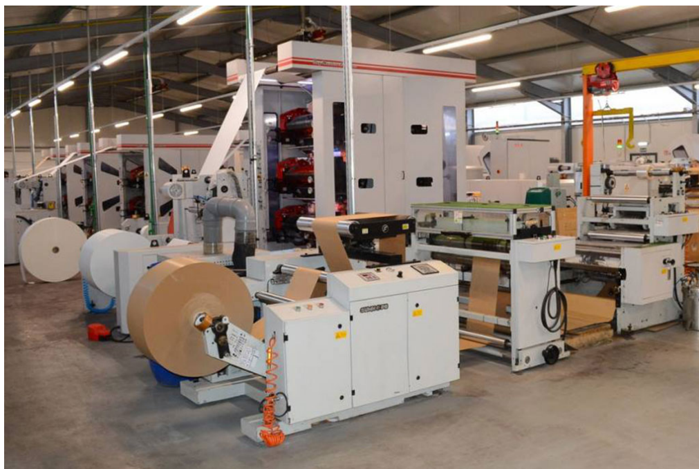
Slika 1 Proizvodni pogon tvrtke Eko papir