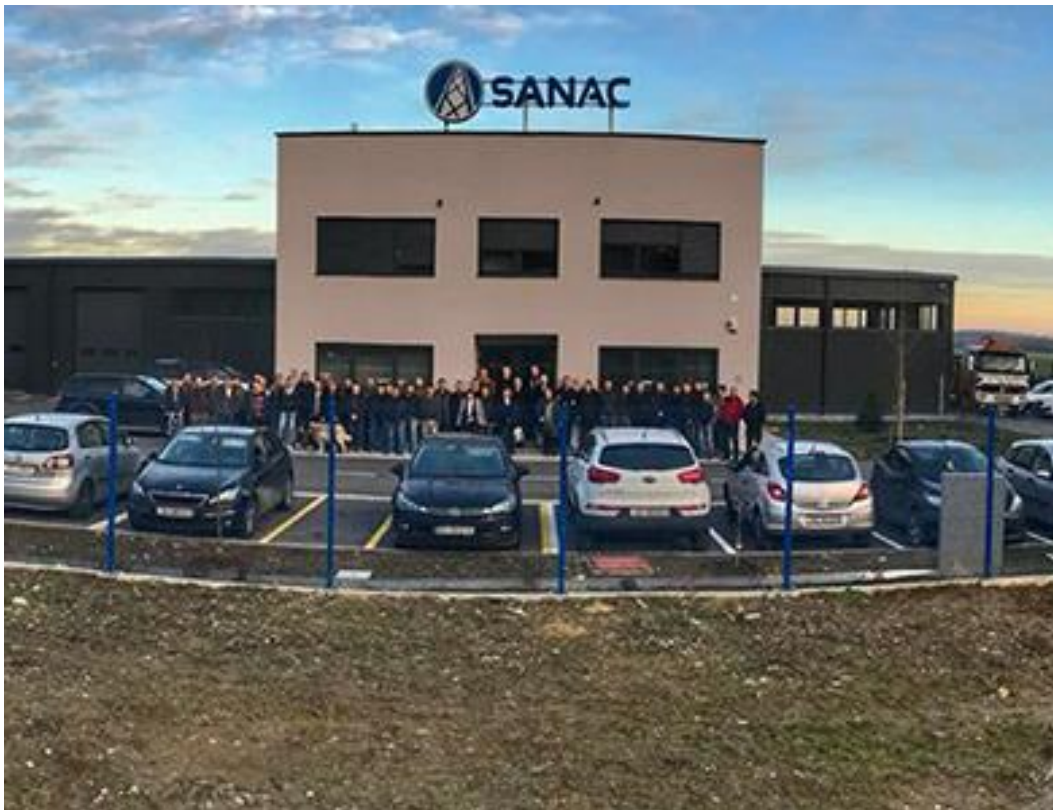
Slika 1. Prikaz sjedišta

Sanac d.o.o. iz Zagreba je renomirano građevinsko poduzeće koje nudi sve vrste građevinskih radova i usluga. S dugogodišnjim iskustvom, primjenom najnovijih tehnologija i pristupa, te usklađenošću s najvišim standardima suvremenog građevinarstva, osiguravamo visoku kvalitetu izvedbe i zadovoljstvo naših klijenata.