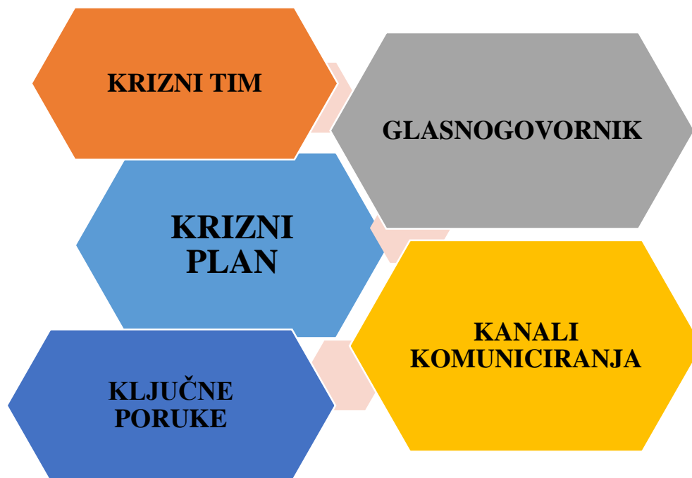
Slika 2. Elementi plana za rješavanje krize