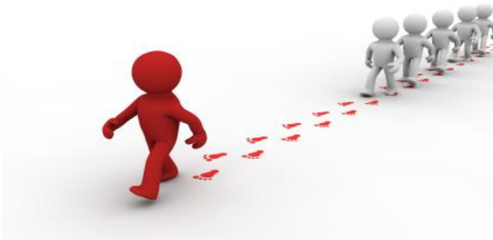
Slika 3. Lider vodi korporaciju