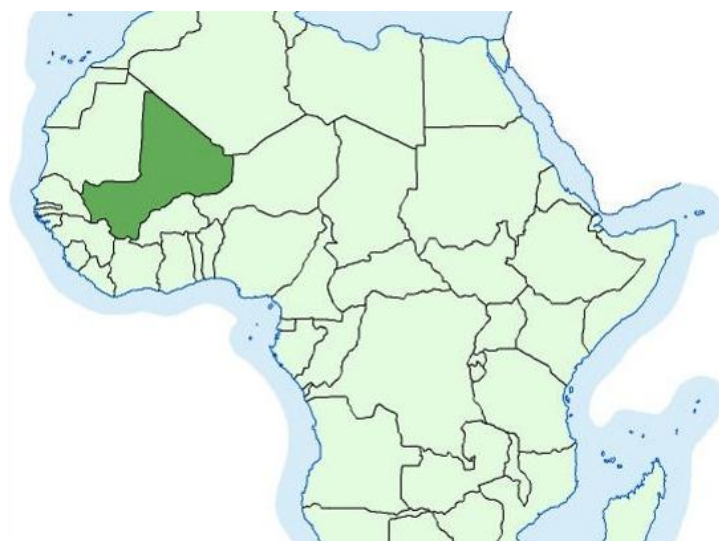
Slika 5 Karta položaja Mali 5

Veći dio zemlje nalazi se na području pustinje Sahare, a manji u Podsaharskoj Africi. Mali je jedna od najsiromašnijih zemalja s BDP-om od oko 900 $ po stanovniku. Gospodarstvo je ovisno o kretanju cijena pamuka i zlata na svjetskom tržištu jer poljoprivreda čini oko 40 % prihoda, a očekuje se da će ga zlato uskoro prestići. Mali je kao i većina država Afrike visoko zadužena, preko 110 % BDP-a. Zlatne rezerve mogle bi biti glavni pokretač novčanih tokova u duljem razdoblju. Izvoz zlata čini oko trećinu ukupnog izvoza. Volumen proizvodnje zlata u zadnjem desetljeću dramatično se povećao te se na taj način servisira vanjski dug. Kako bi se gospodarstvo transformiralo, upravo novčana sredstva dobivena od zlata pomažu u gospodarskim reformama. Ulaže se u razvoj infrastrukture, obrazovanje i daljnji razvoj uvelike ovisi o zlatu.