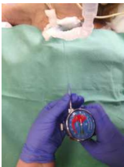
4.1.2.3. Prikaz manometra za provjeru