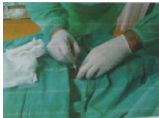
3.6.8. Rezanje kože skalpelom