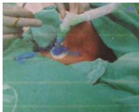
3.6.20. Stavljanje poveske