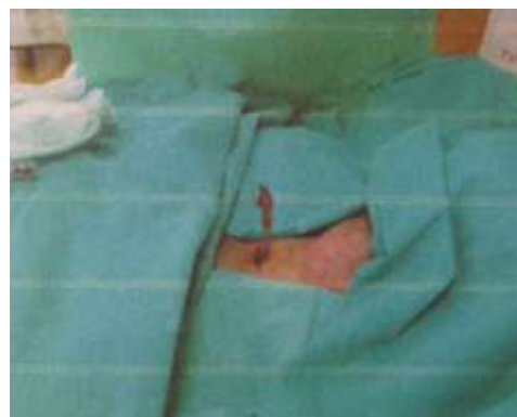
3.6.12. Prikaz nakon aspiracije