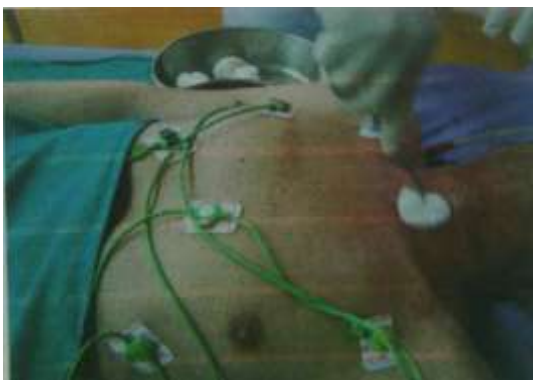
3.6.3. Pranje operativnog polja