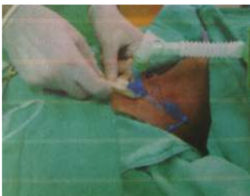
3.6.19. Stavljanje jodoformne gaze