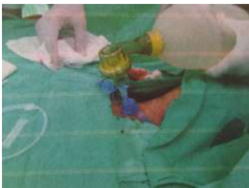
3.6.17. Provjera prohodnosti