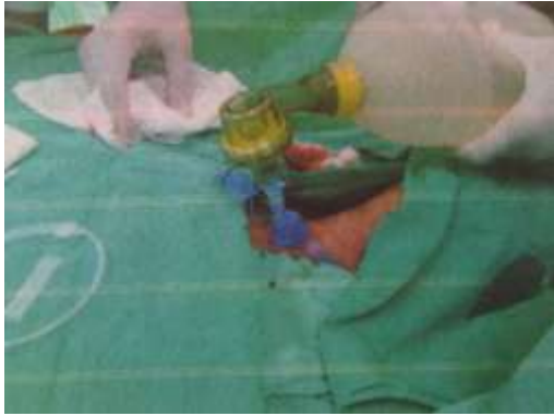
3.6.17. Provjera prohodnosti