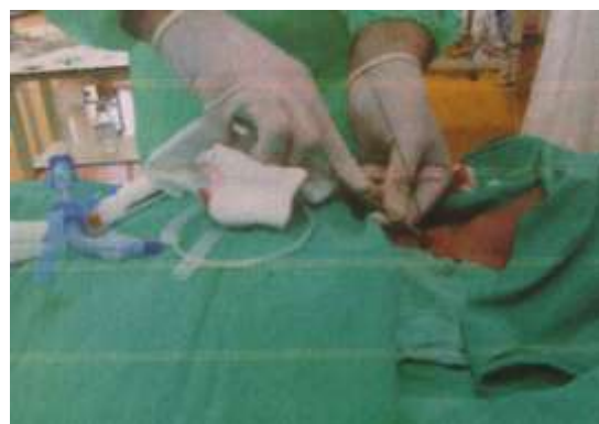
3.6.14. Širenje traheje dilatatorom