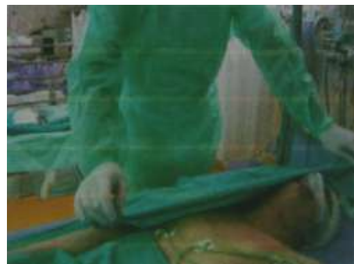
3.6.4. Sterilno pokrivanje pacijenta