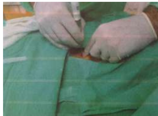
3.6.10. Određivanje mjesta uboda