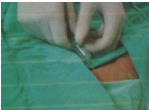
3.6.7. Davanje lokalnog anestetika