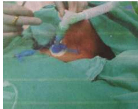
3.6.20. Stavljanje poveske