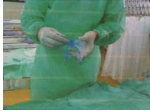
3.6.6. Endotrahealna kanila