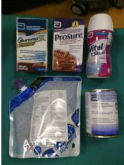
4.4.1.1. Prikaz vrsta hrane za enteralnu prehranu

gravitacijskog sistema u koji stavimo potrebnu količinu hrane koju pacijent treba dobiti te pustimo kapajući kap na kap. Postoji još i način hranjenja putem nazogastrične sonde je putem pumpe hranilice gdje točno možemo zadati vrijeme,brzinu i količinu hrane prikazano je i na slici broj 4.4.1.3.Na slici 4.4.1.2. prikazani su sistemi za hranjenje te šprica za hranjenje.