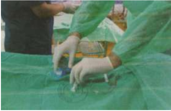
3.6.5. Priprema pribora i otvaranje kanile