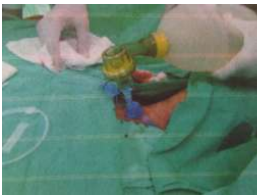
3.6.17. Provjera prohodnosti