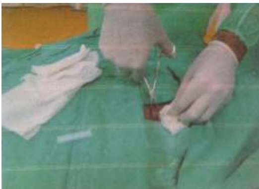
3.6.9. Širenje kože peanom