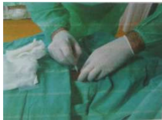
3.6.8. Rezanje kože skalpelom