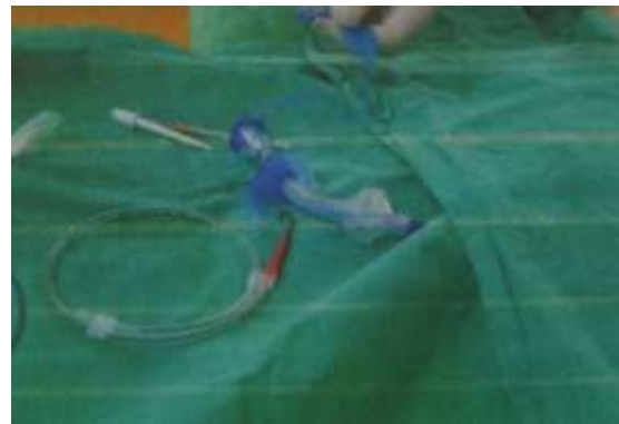
3.6.2. Otvorena kanila