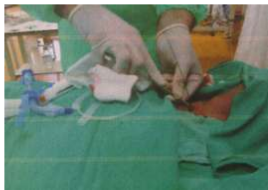
3.6.14. Širenje traheje dilatatorom