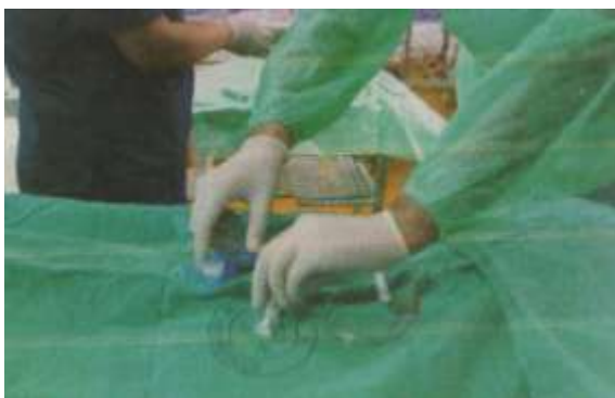
3.6.5. Priprema pribora i otvaranje kanile