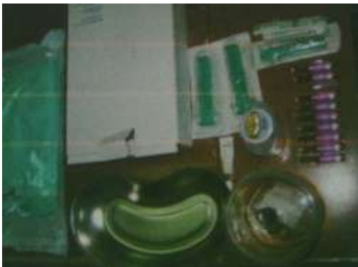
3.6.1. Prikaz pribora za PDT