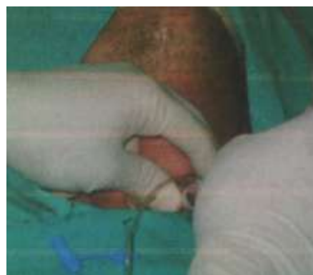
3.6.16. Aspiracija sekreta