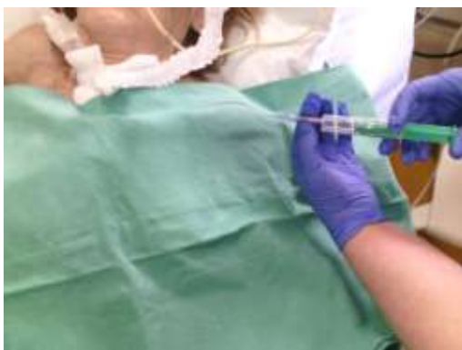
4.1.2.1. Punjenje cuffa zrakom