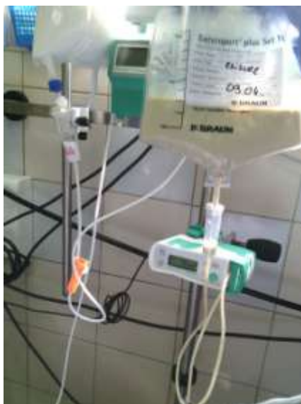
4.4.1.3. Prikaz pumpe hranilice