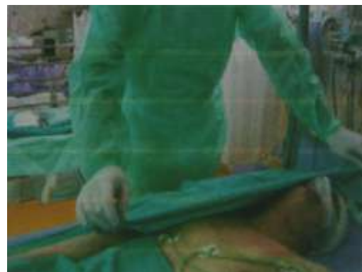
3.6.4. Sterilno pokrivanje pacijenta