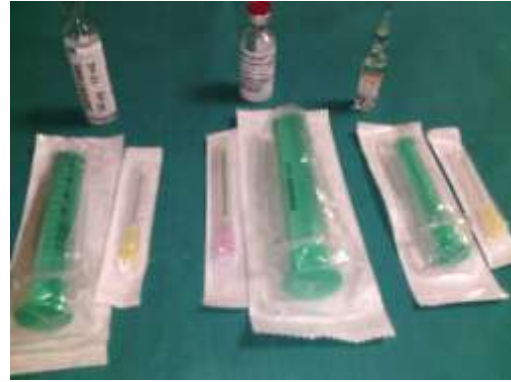
3.5.2. Prikaz anestetika kod PDT