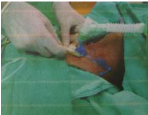
3.6.19. Stavljanje jodoformne gaze