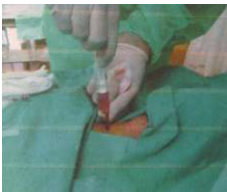
3.6.11. Aspiracija traheje