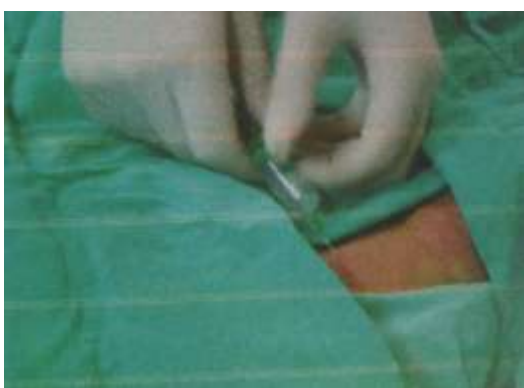
3.6.7. Davanje lokalnog anestetika