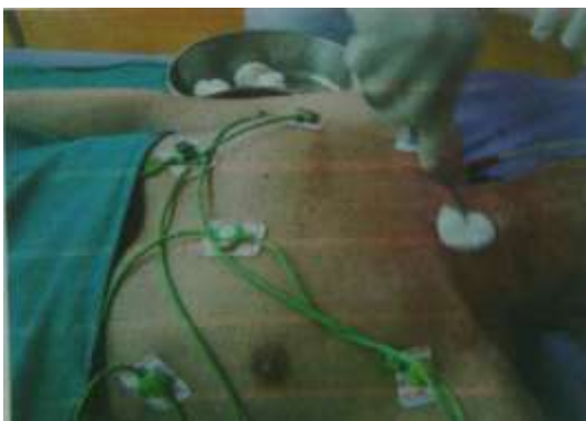
3.6.3. Pranje operativnog polja