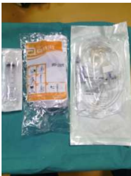
4.4.1.2. Prikaz šprice za hranjenje i setova za enteralnu prehranu