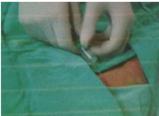
3.6.7. Davanje lokalnog anestetika