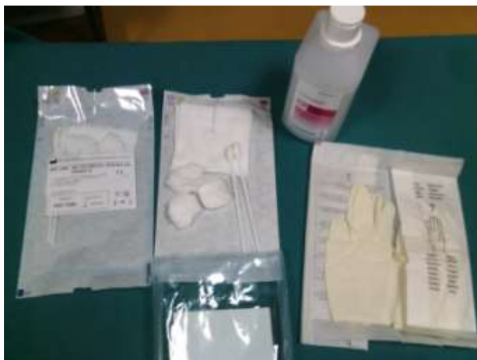
3.4.2.1. Prikaz seta za toaletu ET-kanile