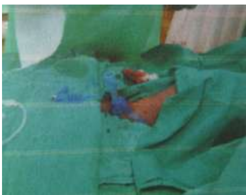
3.6.15. Postavljanje kanile