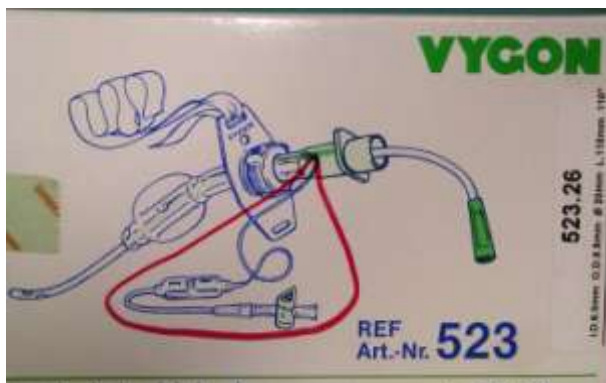
4.1.2.2. Prikaz cuffa