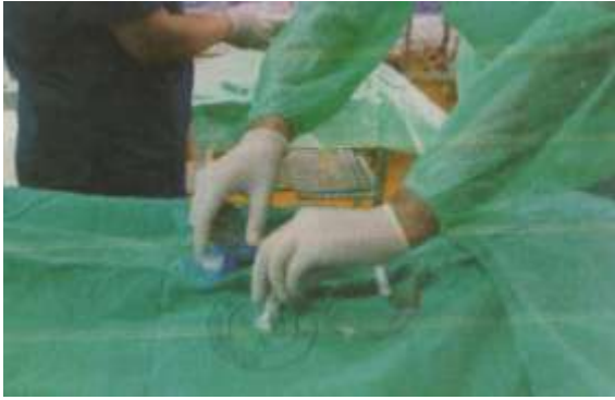
3.6.5. Priprema pribora i otvaranje kanile