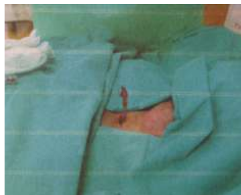
3.6.12. Prikaz nakon aspiracije