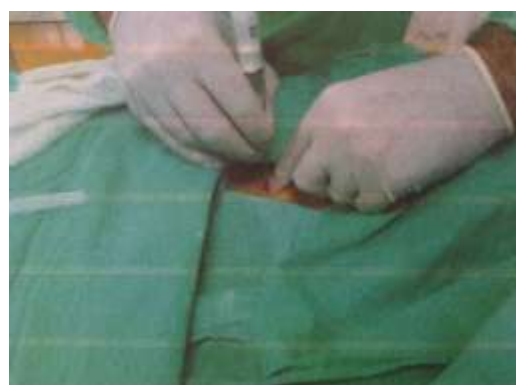
3.6.10. Određivanje mjesta uboda