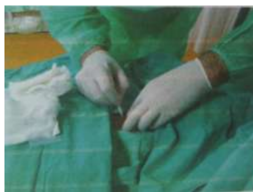
3.6.8. Rezanje kože skalpelom