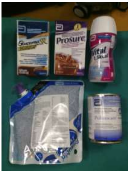
4.4.1.1. Prikaz vrsta hrane za enteralnu prehranu

gravitacijskog sistema u koji stavimo potrebnu količinu hrane koju pacijent treba dobiti te pustimo kapajući kap na kap. Postoji još i način hranjenja putem nazogastrične sonde je putem pumpe hranilice gdje točno možemo zadati vrijeme,brzinu i količinu hrane prikazano je i na slici broj 4.4.1.3.Na slici 4.4.1.2. prikazani su sistemi za hranjenje te šprica za hranjenje.