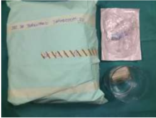
3.5.1. Prikaz seta za PDT