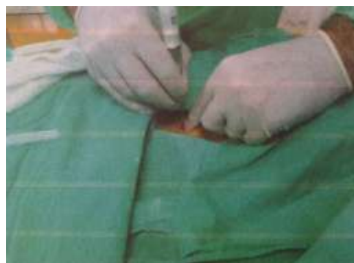
3.6.10. Određivanje mjesta uboda