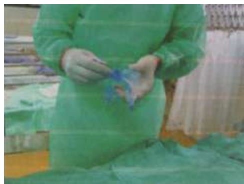
3.6.6. Endotrahealna kanila