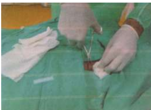
3.6.9. Širenje kože peanom