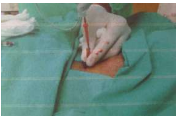
3.6.13. Plasiranje žice vodilice