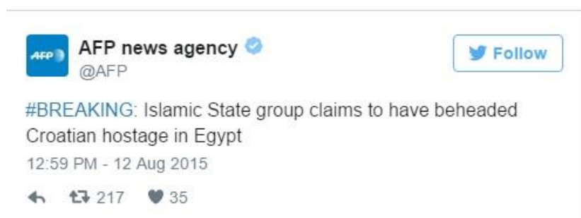
4.3 AFP Twitter

12. kolovoza 2015. godine AFP news agency na svom Twitter profilu objavljuje status kako Islamska država tvrdi da je pogubila Salopeka.