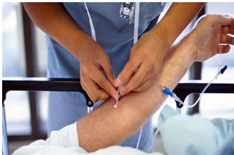
Slika 3.3.1 Prikaz neispravnog pristupa provođenju medicinsko tehničkog zahvata – venepunkcije na pacijentu

Post ekspozicijske mjere se moraju primijeniti unutar 72 sata od trenutka ozljede. Određivanje markera za djelatnika i bolesnika odmah nakon incidenta >48 sati Poznato je da primjena antiretrovirusnih lijekova rano nakon izloženosti HIV-u (u roku od 48-72 sata) smanjuje rizik razvoja infekcije za više od 80%. Ako je potrebno, treba uvesti terapijsku profilaksu djelatnika. Daljnje kontrole provode se kako bi se pravodobno mogla otkriti bolest i što ranije početi s liječenjem. I u slučajevima kada nije prenesena bolest, emocionalni stres ozlijeđenog zdravstvenog ili nezdravstvenog djelatnika i njegove obitelji može biti ozbiljan problem koji zahtjeva savjetovanje. Poslodavac istražuje uzroke i okolnosti te bilježi nesreću/incident i prema potrebi poduzima potrebne mjere. Radnik je dužan u primjerenom roku pružiti relevantne informacije koje su potrebne da se upotpune informacije o nesreći odnosno incidentu. Poslodavac u slučaju ozljede razmatra sljedeće mjere,uključujući,prema potrebi,savjetovanje radnika i zajamčeno liječenje. Rehabilitacija,nastavak radnog odnosa i pristup odšteti podliježu nacionalnom zakonodavstvu. Podaci o ozljedi,dijagnozi i liječenju su povjerljivi i poštivanje njihove tajnosti je od najveće važnosti.[13]