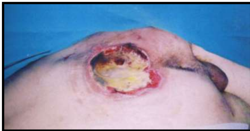
Slika 3.3. Stadij 3. Dekubitus na sakrumu prekriven nekrozama

Potpuni gubitak debljine tkiva. Koža je smeđe boje, tkivo je nekrotično te je vidljiv mišić. Gotovo je uvijek prisutna infekcija. [3] (slika 3.3.)