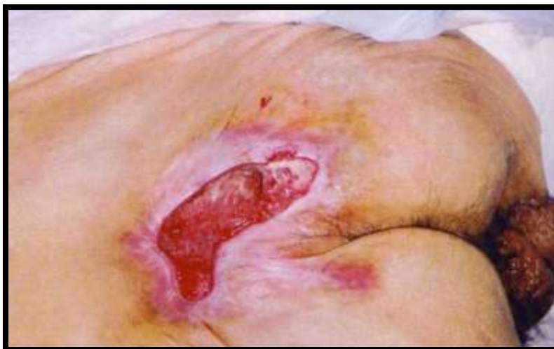
Slika 3.2. Stadij 2. Dekubitusa s torpidnim rubovima i granulacija

Dolazi do stanjenja kože koje zahvaća sve slojeve. U ovom stadiju nastaje površna rana. Karakteriziran je pojavom abrazije, mjehura ili plitkog katetera. Kada dođe do očitih promjena na koži, tada se očekuju i mogo opsežnije promjene na muskulaturi i ovojnicama mišića. [1] (slika 3.2.)