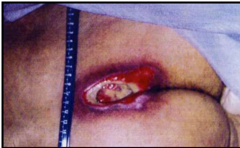
Slika 3.4. Stadij 4. Dekubitalni vrijed na sakrumu

Zahvaćeni su svi dijelovi kože i mišićnog tkiva. Širi na mišiće, kosti, tetive i zglobove. Rana je duboka, nekrotična i neugodnog mirisa. U ovom stadiju gotovo uvijek su prisutne infekcije. Ranu je potrebno kirurški liječiti. [4] (slika 3.4.)