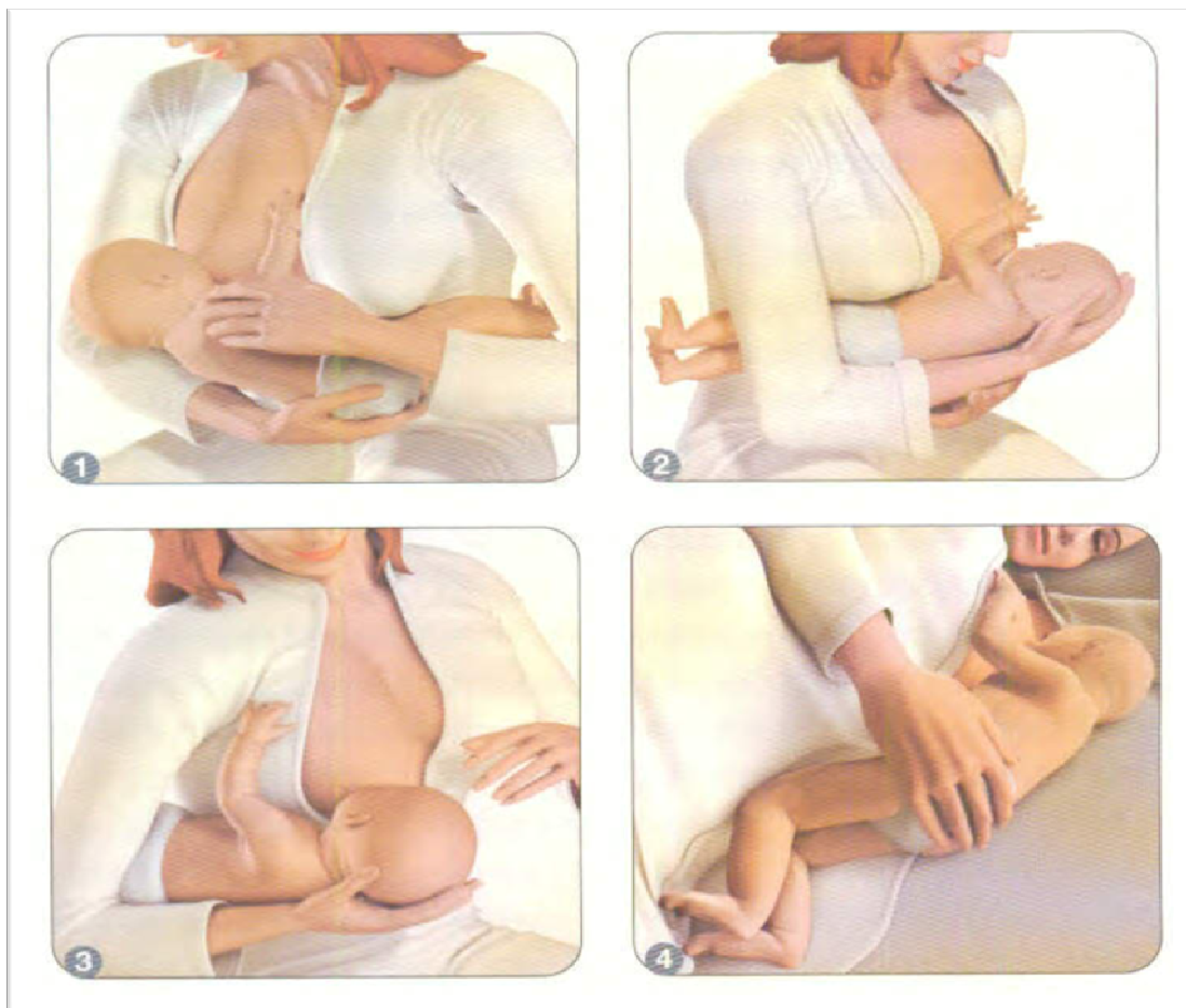
Slika 2.5.1.1. Najadekvatniji položaji za dojenje( prikazani redom opisivanja u tekstu)

Ležeći položaj ugodan je mnogim ženama, naročito noću, a ženama koje su imale epiziotomiju vrlo je praktičan. Mama i dijete leže na boku okrenuti jedno prema drugome. (slika 2.5.1.1.)