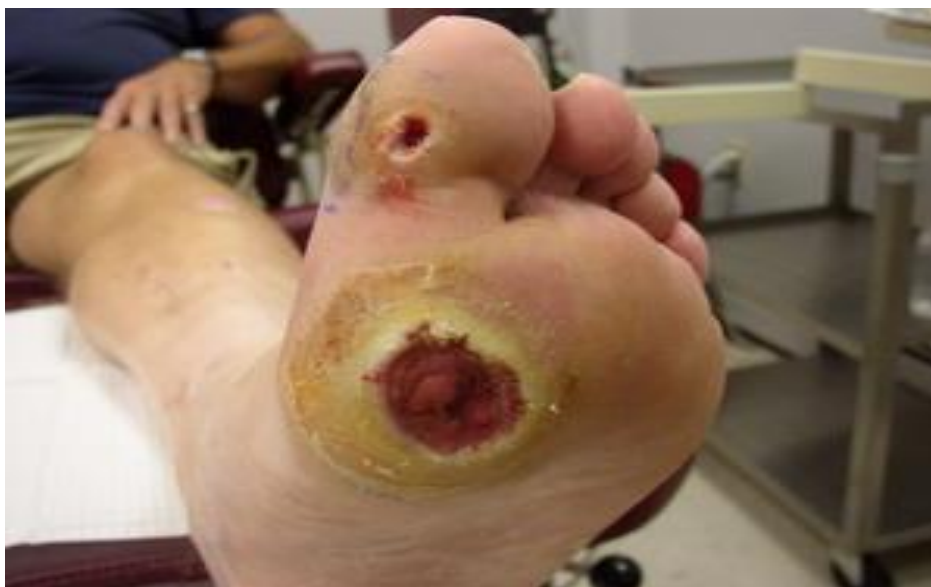
Slika 5.2.3.1. Slika prikazuje dijabetičko stopalo