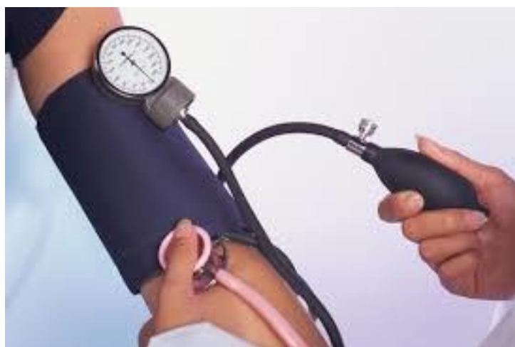
Slika 3.6.1. Mjerenje krvnog tlaka

Prema mogućnostima pacijenta, medicinska sestra treba ga educirati i savjetovati o važnosti samokontrole krvnog tlaka kod kuće. Pritom postoji opasnost da pacijent sam mijenja način liječenja ili mu učestalo mjerenje tlaka izaziva anksioznost. [8]