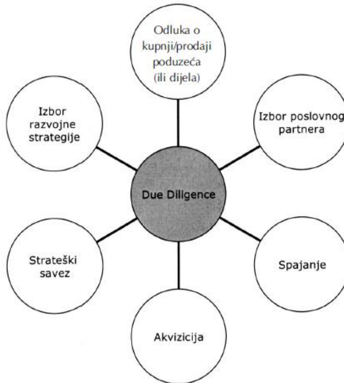
Slika 2.1. Potreba provođenja due diligence-a

Sve navedeno prikazano je na sljedećoj slici.