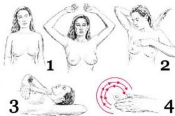
Slika 5.2.1 Samopregled dojke

Na slici 5.2.1 vidi se da je dojka u ležećem položaju spljoštena i lakše se pregleda, potrebno je ležati na jastuku ispod lijevog ramena a lijeva ruka se mora ispružiti iznad glave. Sve postupke je potrebno učiniti i za desnu dojku. [8]