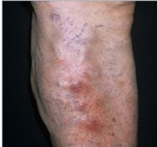
Slika 2.2.2. Tromboflebitis vena