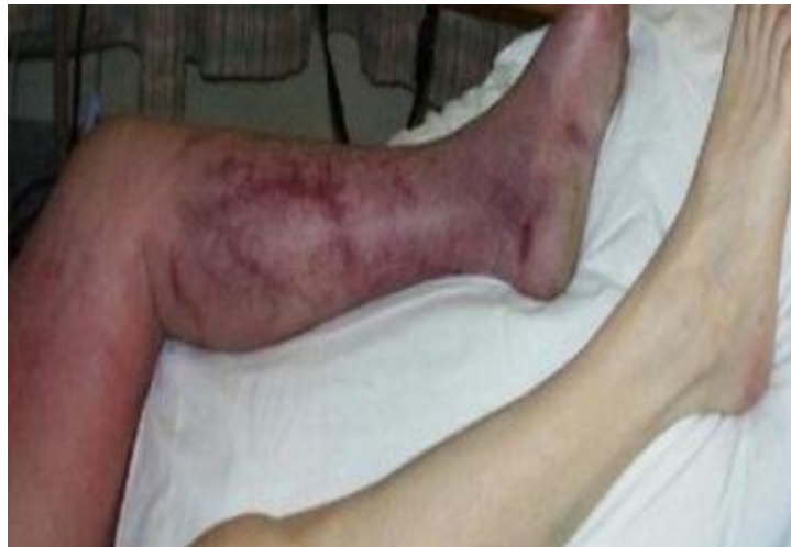
Slika 2.2.3. Duboka venska tromboza