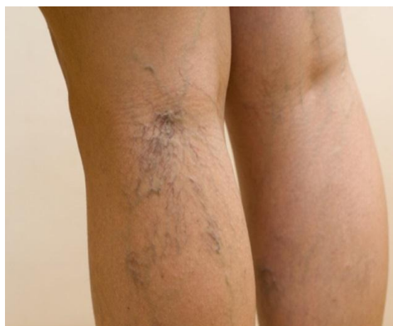
Slika 2.2.1. Varikozne vene

Liječenje: Upotrebljavaju se elastične čarape ili zavoji. Bolesnik ne smije duže stajati ili sjediti te dizati terete. Bolesnicima s pretjeranom tjelesnom težinom preporučuje se redukcija težine tj smanjenje uz adekvatnu dijetu. Liječi se još kirurški ili sklerozacijom.