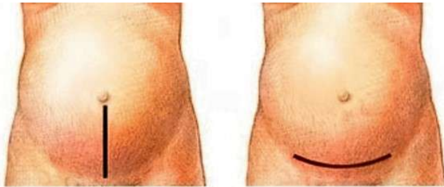
Slika 2.3.1. Prikaz Laparotomije

Laparotomija je kirurški zahvat koji se odnosi na otvaranje trbušne šupljine. U ginekologiji trbušna šupljina se najčešće otvara uzdužnim rezom (donja medijalna laparotomija, rez pupak - simfiza) koja se može prema potrebi proširiti kranijalno (rez ksifoid – pupak) ili donjim poprečnim rezom (laparotomija po Pfannenstielu) [30,31]. Sam prikaz dva najčešća načina otvaranja trbušne šupljine prikazani su na slici 2.3.1.