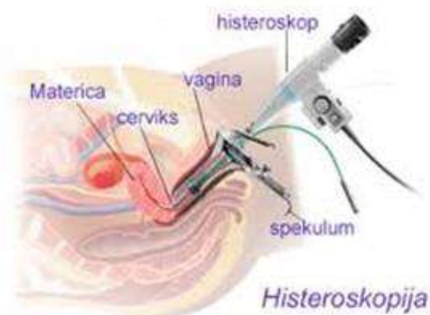
Slika 2.2.1.1. Prikaz histeroskopije

Histeroskopska operacija je dijagnostički i/ili kirurški zahvat u materištu. Obavlja se u prvoj fazi menstrualnog ciklusa. Većina dijagnostičkih postupaka ne zahtijeva nikakvu anesteziju, samo parcervikalnu analgeziju ako je potrebna dilatacija endocervikalnog kanala. Sama HSC prikazana je na slici 2.2.1.1.